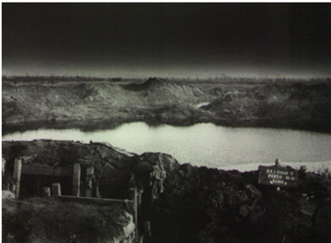
Figura 5 – Terra de Ninguém