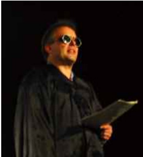
Figura 3 - Jelly Biafra

O IMC foi criado, em 1999, pela mão de Jelly Biafra, ou de seu verdadeiro nome Eric Boucher. Jelly Biafra esteve ligado a varias actividades nos média. Participou em grupos musicais associados aos movimentos punk do fim do século passado, entre os grupos em que participou o mais conhecido terá sido os Dead Kennedys .