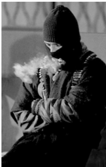
Figura 1 - O subcomandante Marcos

“internacionalización” del conflicto que esas manifestaciones suponen. Parece ser que, lo que llamaron despectivamente “ una guerra de Internet ”, les ha provocado dolores de cabeza en embajadas y consulados.” Janeiro de 1998.