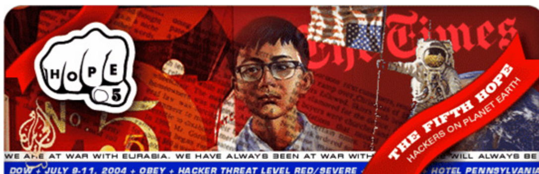
Figura 4 - HOPE - Hackers on Planet Earth

década de 60 do século passado e questionarmos como teria sido o Maio de 68 em França se a Internet estivesse acessível nessa altura!