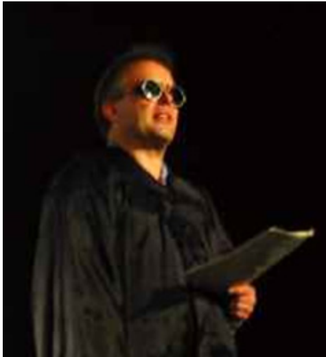
Figura 3 - Jelly Biafra

O IMC foi criado, em 1999, pela mão de Jelly Biafra, ou de seu verdadeiro nome Eric Boucher. Jelly Biafra esteve ligado a varias actividades nos média. Participou em grupos musicais associados aos movimentos punk do fim do século passado, entre os grupos em que participou o mais conhecido terá sido os Dead Kennedys .