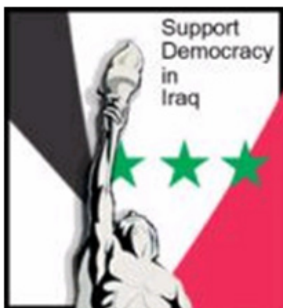
Figura 7 - Imagem do Warlog - “Salam Pax”

Outra particularidade que surgiu com a guerra foi a especialização do conceito de weblog , dando origem ao conceito de warlog (a tradução à letra seria - diário de guerra). Surgiram dezenas de weblogs dedicados a este tema, basta consulta a página do Yahoo 11 , para termos uma ideia da quantidade, entre weblogs oficiais (ligados a jornais) podemos contar mais de sessenta diários de guerra ou relacionados com a guerra.