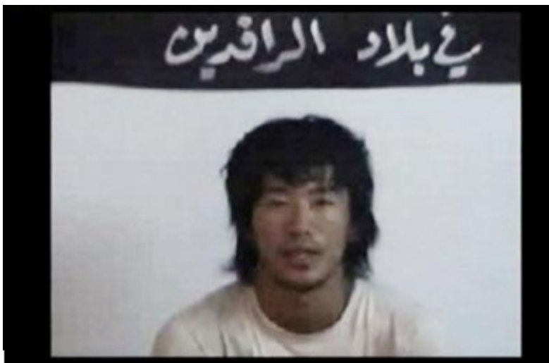
Figura 5 - Imagem de refém divulgada na net 9

Para o leitor menos atento à realidade da Internet, as últimas afirmações até podem parecer um exagero, no entanto devemos lembrar que os órgãos de comunicação social usam muitas vezes a Internet como fonte de informação 10 . Um outro dado curioso e sem dúvida mórbido e que de algum modo nos surpreendeu nesta investigação é que, por exemplo, as imagens relativas à execução de prisioneiros no Iraque são distribuídos na Internet podendo facilmente ser obtidos como qualquer aplicação de partilhas de ficheiros tipo eMule ou Kazaa, como se mostra na Figura 4.2, ou seja para além de serem distribuídas a partir de sites dos terroristas são perpetuadas na Internet por utilizadores anónimos.