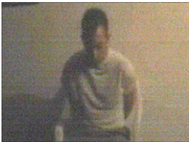
Figura 9 - Imagem do vídeo forjado

Em qualquer dos dois casos um dos pontos que salta à vista é o facto da impossibilidade de verificar a veracidade das afirmações, nem sequer é possível confirmar que os dois autores se encontram realmente onde dizem que estão, e este é sem dúvida um dos grandes problemas que este tipo de suporte levanta. Como ficou demonstrado pelo americano Benjamin Vanderford 14 , um criador de jogos de computador de 22 anos de idade e membro do grupo de musical experimental “fluorescent grey”. Em Maio de 2003, Benjamin forjou um vídeo com imagens da sua fictícia execução 15 por parte de um grupo terrorista.