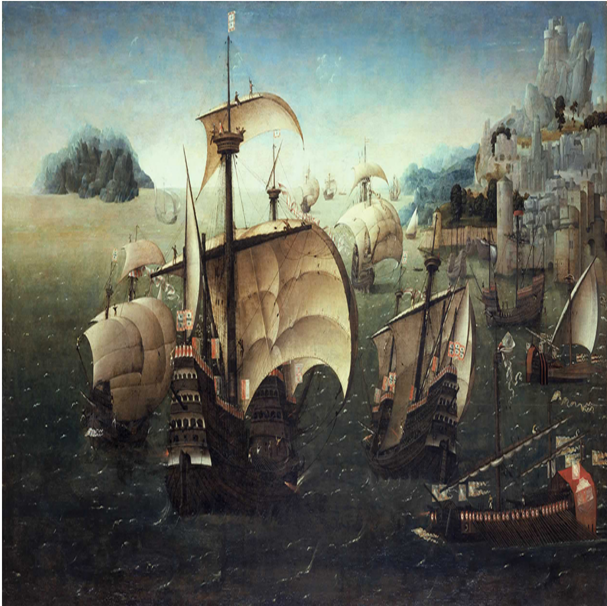
Naus e galés portuguesas do séc. XVI

Outro aspeto relevante da Arte da Guerra do Mar é a forma como aborda alguns dos princípios intemporais da estratégia. Incluem-se, abaixo, alguns desses princípios, ilustrando cada um deles com citações da Arte da Guerra do Mar :