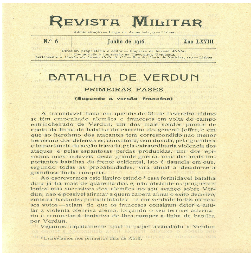
Figura 1 – Primeira página do primeiro artigo publicado na Revista Militar (junho de 1916).