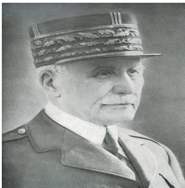
Figura 3 - O general Pétain.

É desde os primeiros dias de maio até meados de julho, quando se desenvolve a terceira fase da batalha, onde se assiste à esperada iniciativa alemã, que se converte numa batalha de atrição como as de 1914, com grandes perdas para as duas partes, principalmente para o exército francês que chegou a empenhar uma nova Divisão de dois em dois dias e que seriam dizimadas pela sequência de contra-ataques e por causa do fogo da artilharia alemã. A ofensiva coligada do rio Somme fez com que o general Erich Falkenhayn decidisse pôr fim à luta no sector de Verdun e, em dois últimos ataques (23 de junho e 11 de julho), os alemães conseguem atingir a povoação de Fleury, a 2,5 km de Verdun, bem como consolidar os pontos de cota 304 e a região de Mort-Homme. Enquanto decorria no sector do rio Somme a ofensiva, os alemães mantiveram no sector de Verdun uma defesa ativa com ataques locais limitados essencialmente para fixar forças inimigas, para que estas não se deslocarem para o Somme, influenciando a batalha.