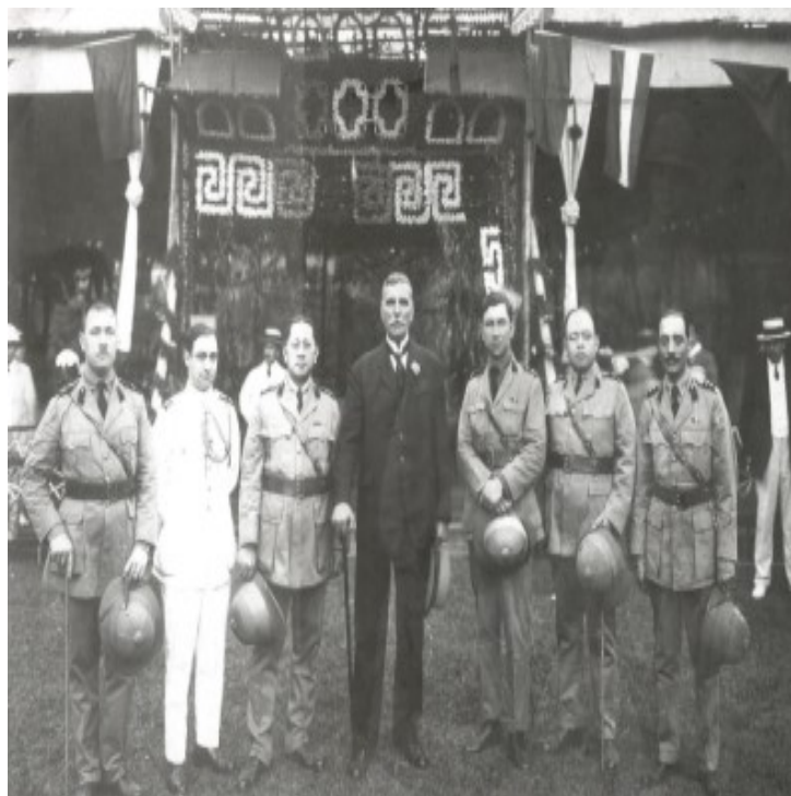
Figura 8 - Visita do General Gomes da Costa aos SVC durante a sua inspeção extraordinária às colónias do Oriente (1923).

Passados alguns anos, a 5 de Outubro de 1932, o Governo de Portugal honra a Companhia Portuguesa com a Ordem de Cristo, por todo o trabalho patriótico e anos de lealdade ao serviço do SVC, contribuindo para a defesa dos cidadãos portugueses em Xangai.