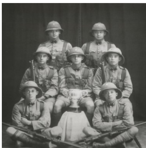
Figura 6 - Companhia Portuguesa vencedora da "British Cup" (1926).