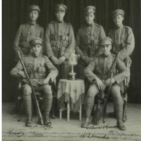
Figura 7 – Campeões do concurso anual de tiro, ano de 1930.