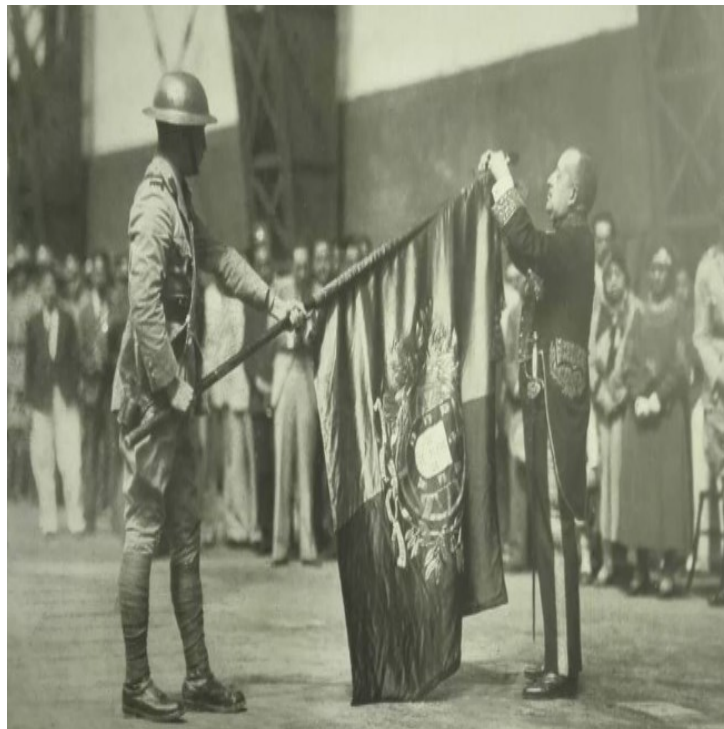
Figura 9 - Condecoração da SVC “Companhia Portuguesa” com a Ordem de Cristo (5 de Outubro de 1932) pelo Ministro de Portugal na China, Dr. Armando Navarro.

Na década de 30, novos ventos sopravam por toda a Ásia. O movimento de agressão por parte do Império Japonês contra a China, nomeadamente a anexação da Manchúria e o bombardeamento de Xangai em 1932, levou o Conselho do Município de Xangai a iniciar os preparativos para a resistência da cidade. Dentro destas medidas, a que mais afectou a Companhia Portuguesa foi a ordem para a constituição de quatro pelotões com um limite total de 164 homens, número que nunca foi atingido por falta de armamento.