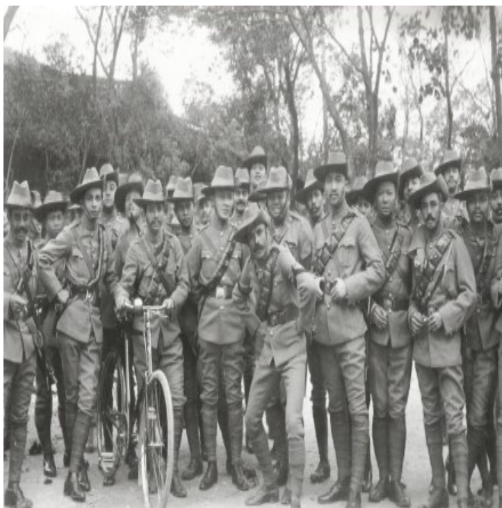
Figura 3 - Fotografia tirada imediatamente após a conclusão de exercícios de treino, conjuntamente com a Companhia Alemã (4 de Novembro de 1906).