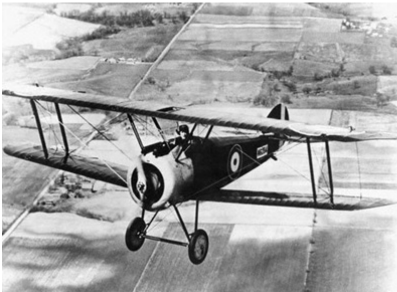
The 1917 Sopwith Camel biplane accounted for more aerial victories than any other allied aeroplane during WWI, destroying over 1,200 enemy in combat. The Camel acquired its name from its twin Vickers .303 calibre machine guns, which were housed in a "hump" forward of the pilot.

Na primeira guerra dos Balcãs, em 1912, já os aviadores búlgaros lançavam manualmente pequenas bombas sobre as tropas inimigas.