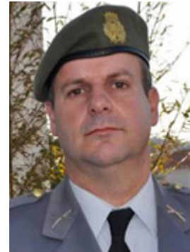
Brigadeiro-general Nuno Correia Barrento de Lemos Pires

Para quem segue as grandes questões de Segurança e Defesa no mundo, há um documento que é, sempre, muitíssimo aguardado: A Estratégia Nacional de Segurança dos Estados Unidos da América (EUA) - National Security Strategy (NSS) . Desde que Donald Trump assumiu a presidência dos EUA, vínhamos assistindo a vários anúncios de alterações profundas na estratégia de segurança dos EUA, pelo que foi com, ainda maior, expectativa que lemos a NSS publicada no passado mês de Dezembro de 2017 (disponível para consulta em: http://nssarchive.us/wp-content/uploads/2017/12/2017.pdf - ver figura 1). Vamos fazer uma leitura, necessariamente breve, dos tópicos que pensamos serem mais relevantes para entender as mudanças, ou em alguns casos, as não mudanças, na grande Estratégia dos EUA.