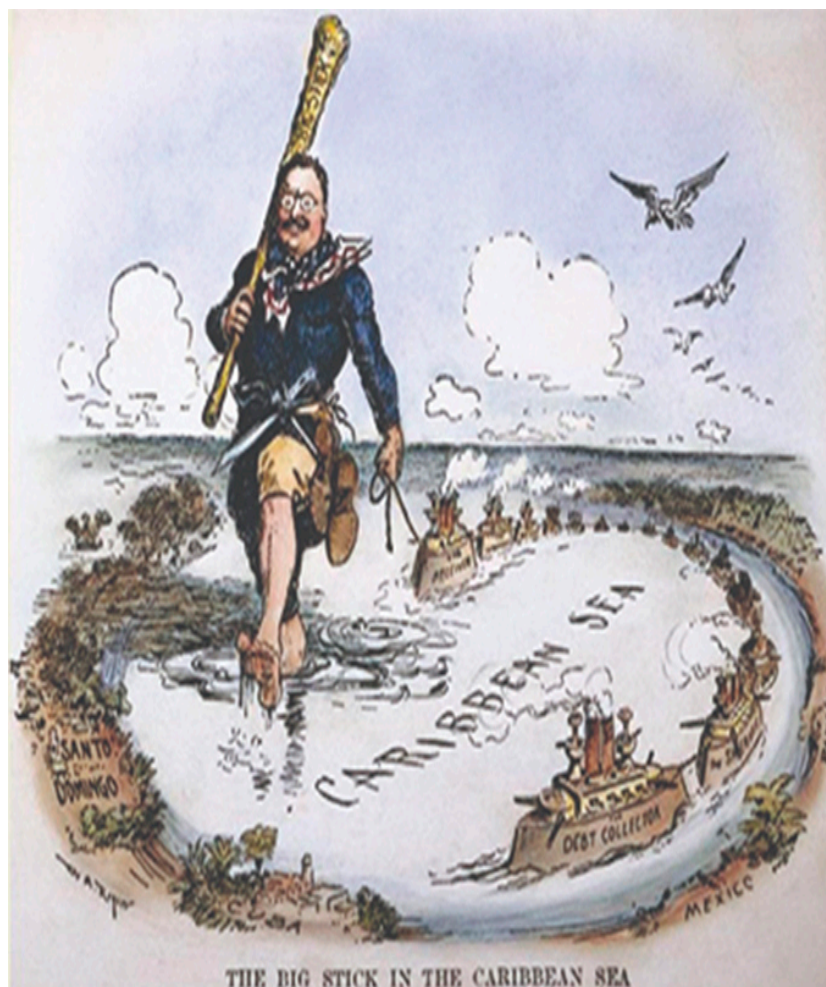
Figura 1 - Theodore Roosevelt (Presidente Americano de 1901 a 1909) transformando o Mar das Caraíbas num “lago norte-americano”,

por força da utilização do famoso “ The Big Stick ” 10 .