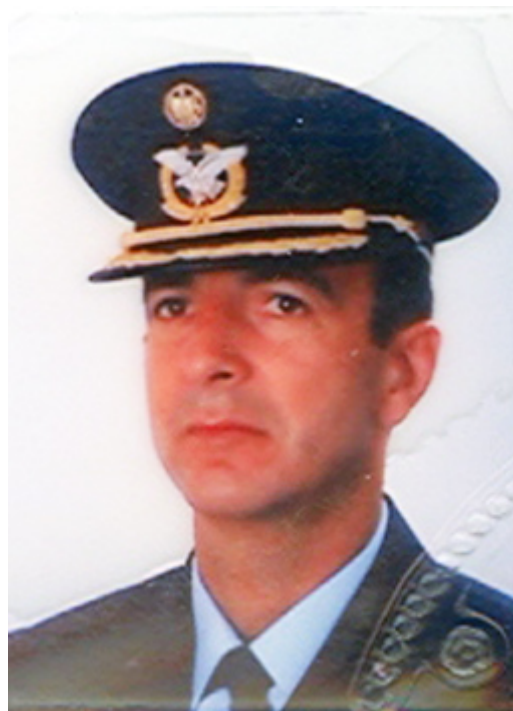
Coronel Francisco José de Carvalho Cosme

“Julgamos propícia esta ocasião para afirmar, como um princípio que afecta os direitos e interesses dos Estados Unidos, que os continentes americanos, em virtude da condição livre e independente que adquiriram e conservam, não podem mais ser considerados, no futuro, como susceptíveis de colonização por nenhuma potência europeia [...]”