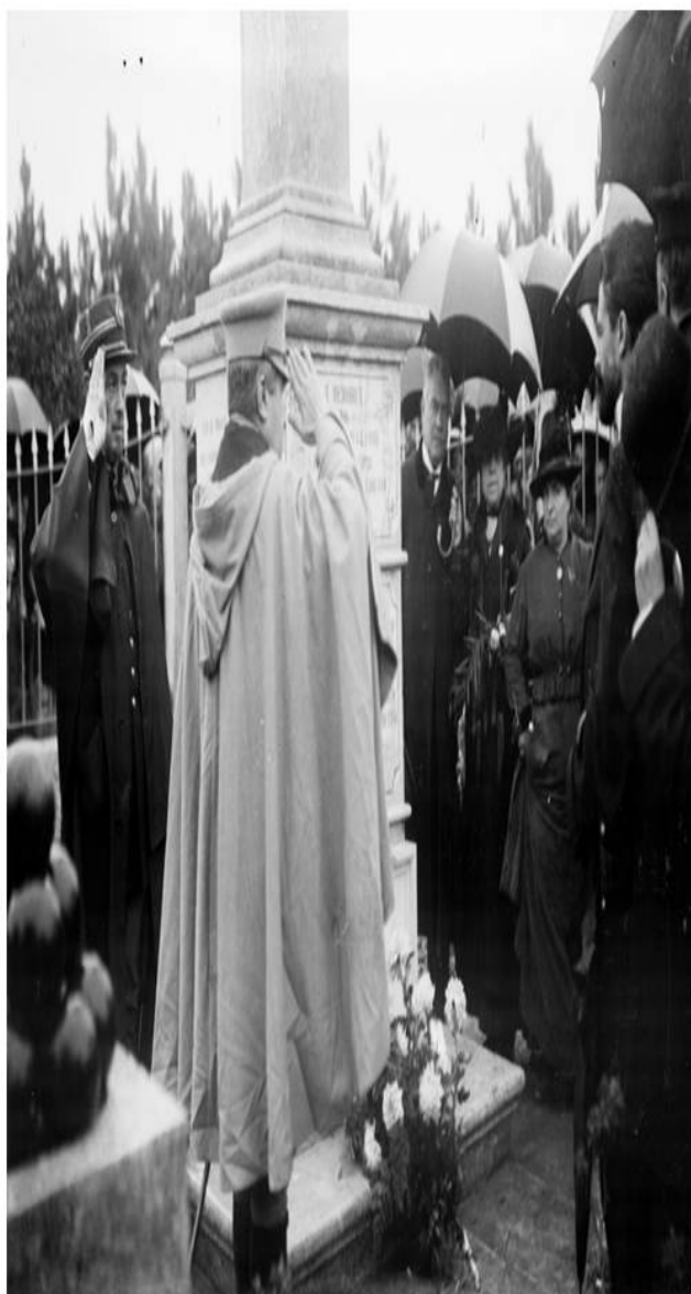
Figura 5 - Norton de Matos na cerimónia junto ao monumento, em São Julião da Barra.

A posição das duas Obediências maçónicas era, assim, coincidente no apoio ao esforço de guerra, aproveitando o Centenário de Gomes Freire para o afirmarem publicamente.