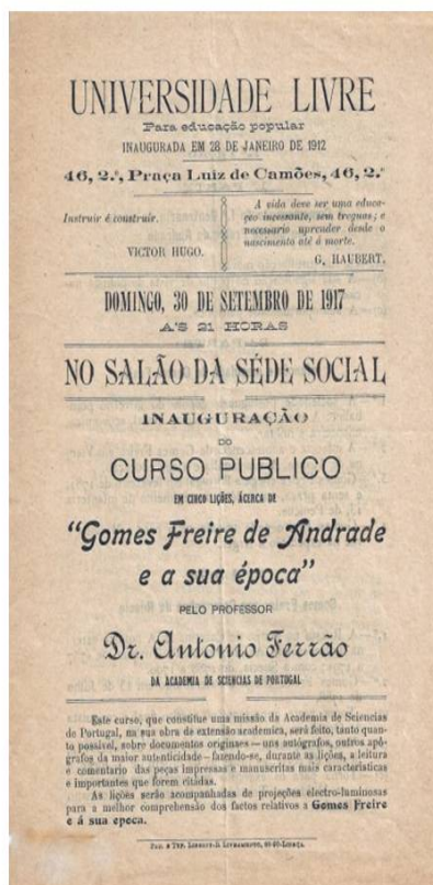
Figura 11 – Divulgação do Curso da Universidade Livre.

A Universidade Livre, instituição fundada em 1911, por iniciativa da Maçonaria, dirigida durante muitos anos pelo destacado maçom Alexandre Ferreira, organizou um curso em cinco lições intitulado «Gomes Freire de Andrade e a sua Época», ministrado por António Ferrão numa missão da Academia das Ciências na sua obra de extensão académica. O curso, acompanhado de «projeções luminosas», iniciou-se a 30 de Setembro de 1917. António Ferrão tinha sido iniciado em 1907 na Loja Solidariedade , mas não se encontrava activo desde 1914, só vindo a ser regularizado em 1924 na Loja Madrugada . Publicou, em 1918, o livro Gomes Freire na Rússia [14] e, dois anos depois, publicava o texto de um discurso que proferira em 18 de Novembro de 1917, intitulado Gomes Freire e as Virtudes da Raça Portuguesa [15] .