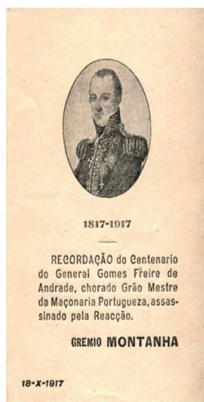
Figura 9 - Selo comemorativo. comemorativa.