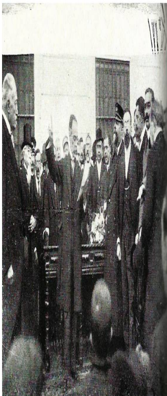
(Ilustração Portuguesa nº 611, 5-11-1918, p. 368)