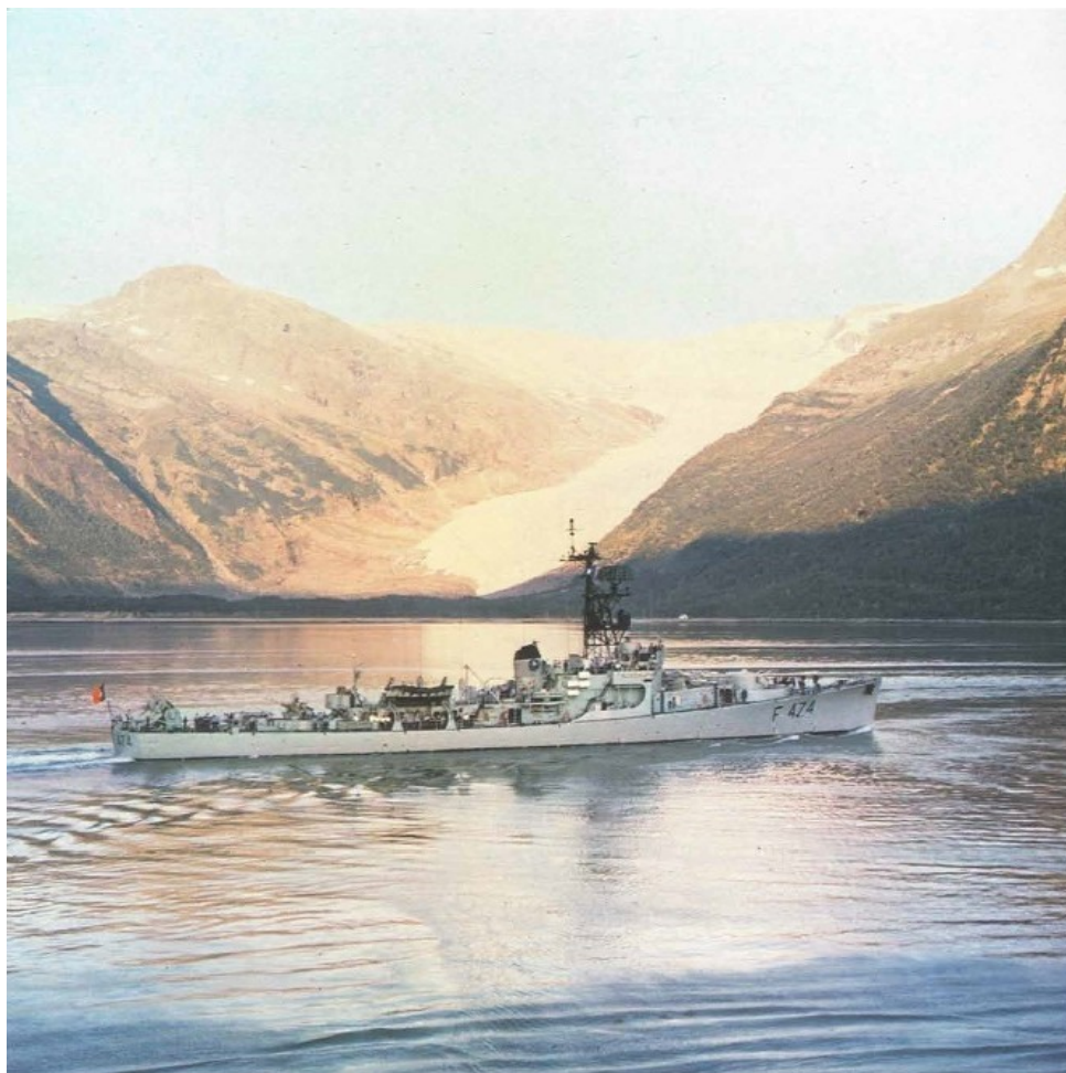
Figura 3 - Fragata Almirante Magalhães Corrêa navegando nos fiordes da Noruega, integrada na STANAVFORLANT, em 1981.

No âmbito da STANAVFORLANT, nessa época ( i.e. , em plena guerra fria), as unidades navais portuguesas exercitavam conceitos essencialmente defensivos, tendo em vista a proteção dos corredores de navegação transatlânticos, designadamente, de comboios de navios transportando reforços militares para a Europa (com foco nas táticas de luta anti-submarina e anti-aérea), não descurando, contudo, planos de operações contemplando uma eventual confrontação direta no mar.