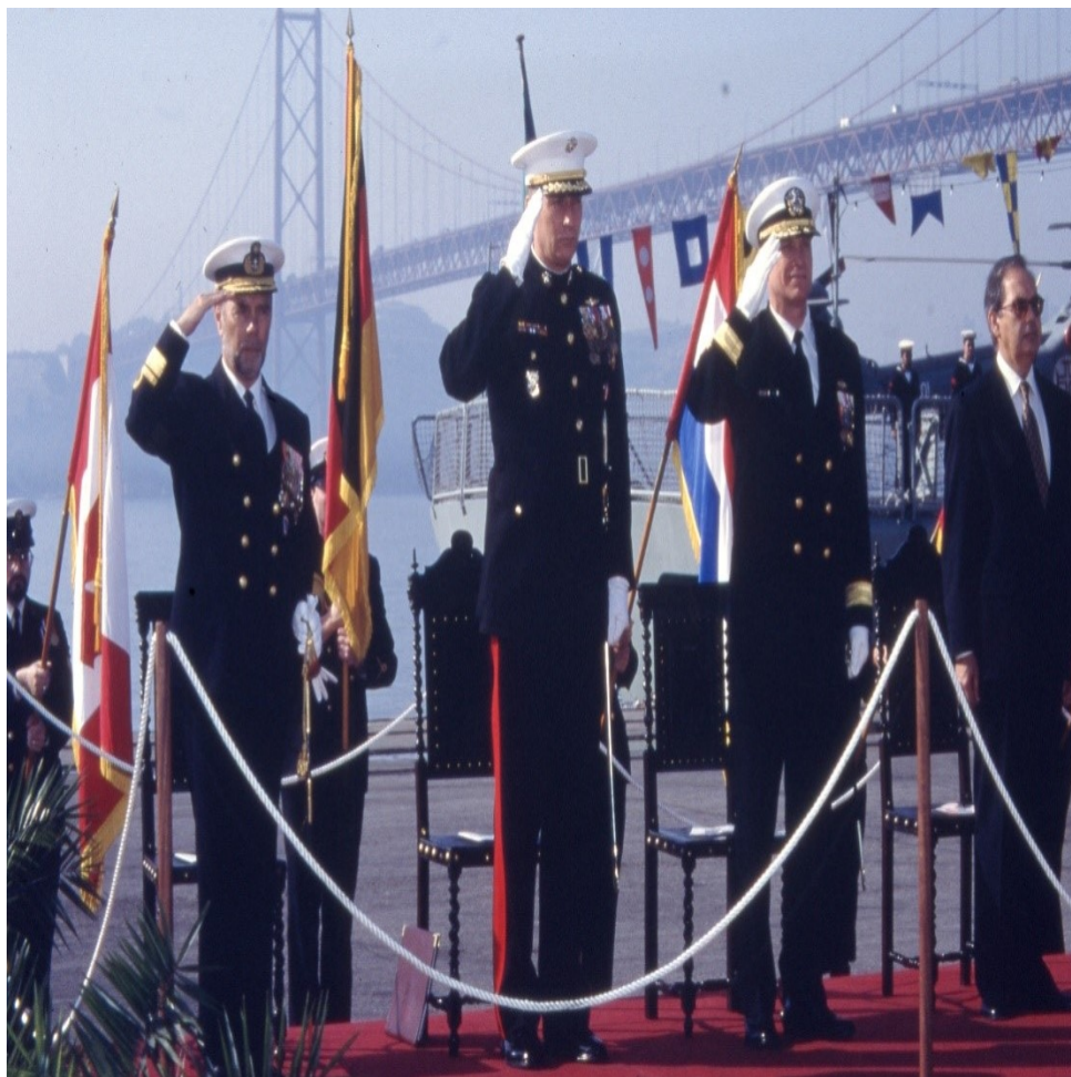
Figura 6 - Cerimónia de mudança de comando da STANAVFORLANT, em 6 de abril de 1995, no cais de Alcântara em Lisboa, com o Contra-almirante Reis Rodrigues a assumir o comando da força.

Neste período de envolvimento da NATO na contenção da crise resultante do desmembramento da ex-Jugoslávia, importa registar, também, a participação entre janeiro e agosto de 2000 de uma companhia de fuzileiros, integrada no Agrupamento Conjunto Alfa, ao serviço da Stabilization Force (SFOR). A SFOR foi uma força de manutenção de paz, de âmbito multinacional, formada no quadro da NATO, com a missão de pôr fim às hostilidades, consolidar a paz e contribuir para um ambiente seguro no território da Bósnia-Herzegovina. Esta foi a primeira vez que uma força de fuzileiros foi empenhada no âmbito da NATO e, também, a primeira vez que os fuzileiros foram empregues num teatro de operações localizado no continente europeu, desde a Grande Guerra (1914-18).