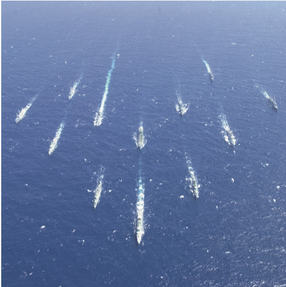
Figura 7 - A STANAVFORLANT no mar, sob comando do Comodoro Melo Gomes e com a fragata Álvares Cabral integrada na força, durante o exercício SWORDFISH 2001.

O apoio médico viria também a alargar-se ao Paquistão, na sequência do violento sismo que atingiu a região de Cachemira, no nordeste do país, em 8 de outubro de 2005. Sem capacidade para enfrentar tamanha tragédia de forma autónoma, o governo paquistanês solicitou o apoio da comunidade internacional e da própria NATO, que aqui desencadeou a sua primeira missão exclusivamente dedicada à assistência humanitária, com a ativação da NATO Pakistan Earthquake Relief Assistance . Essa missão incluiu a instalação de um hospital de campanha, em que a Marinha empenhou uma equipa de ginecologia-obstetrícia constituída por uma médica e uma enfermeira, entre dezembro de 2005 e janeiro de 2006 (ver figura 8).