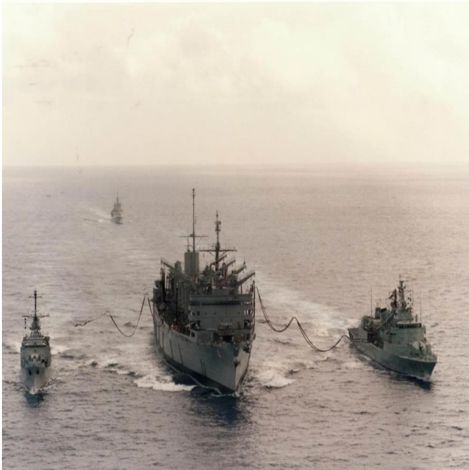
Figura 5 - Fragata Vasco da Gama (à direita) a efetuar reabastecimento no mar, durante a primeira integração de um navio da sua classe na STANAVFORLANT, em 1992.

Tudo isso permitiu que Portugal passasse a integrar o restrito número de Aliados com capacidade para comandar, em regime de rotação, as forças navais permanentes da NATO. Este foi um salto qualitativo extraordinário para a Marinha Portuguesa que, desde essa altura, já exerceu por quatro vezes o comando da força naval permanente da NATO no Atlântico, conforme tabela junta.