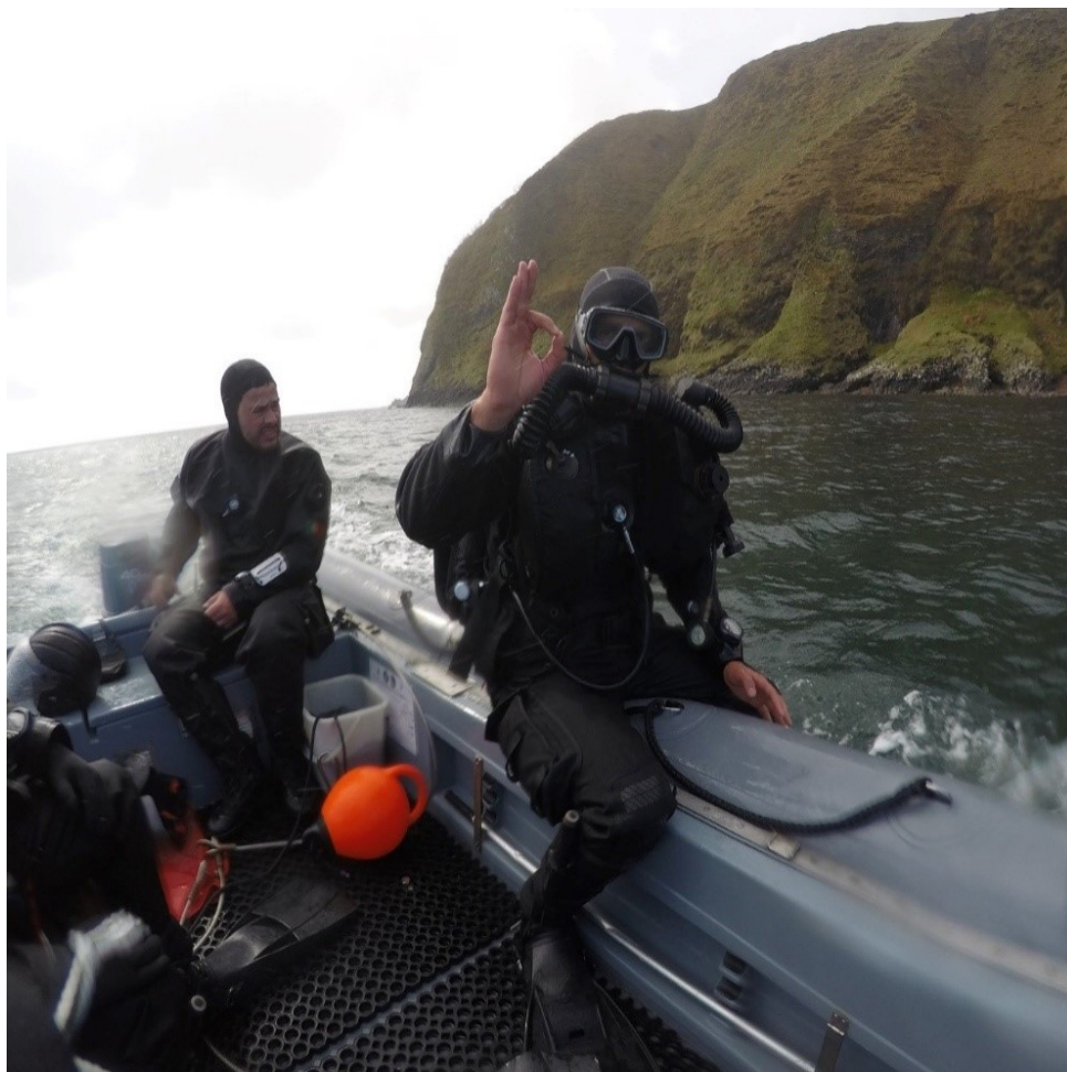
Figura 12 - Equipa de mergulhadores-sapadores portugueses integrada no SNMCMG-1 (2018).

Também no ano passado (2018) ocorreu a primeira integração de equipas de mergulhadores portugueses, com valências no domínio das contramedidas de minas, num dos grupos-tarefa de elevada prontidão da NATO dedicados à guerra de minas: o Standing NATO Mine Counter-Measures Group 1 (SNMCMG-1) - uma das forças que sucedeu às Standing Naval Forces Channel 1 e 2 (STANAVFORCHAN-1 e 2), criadas em 1973 (ver figura 12).