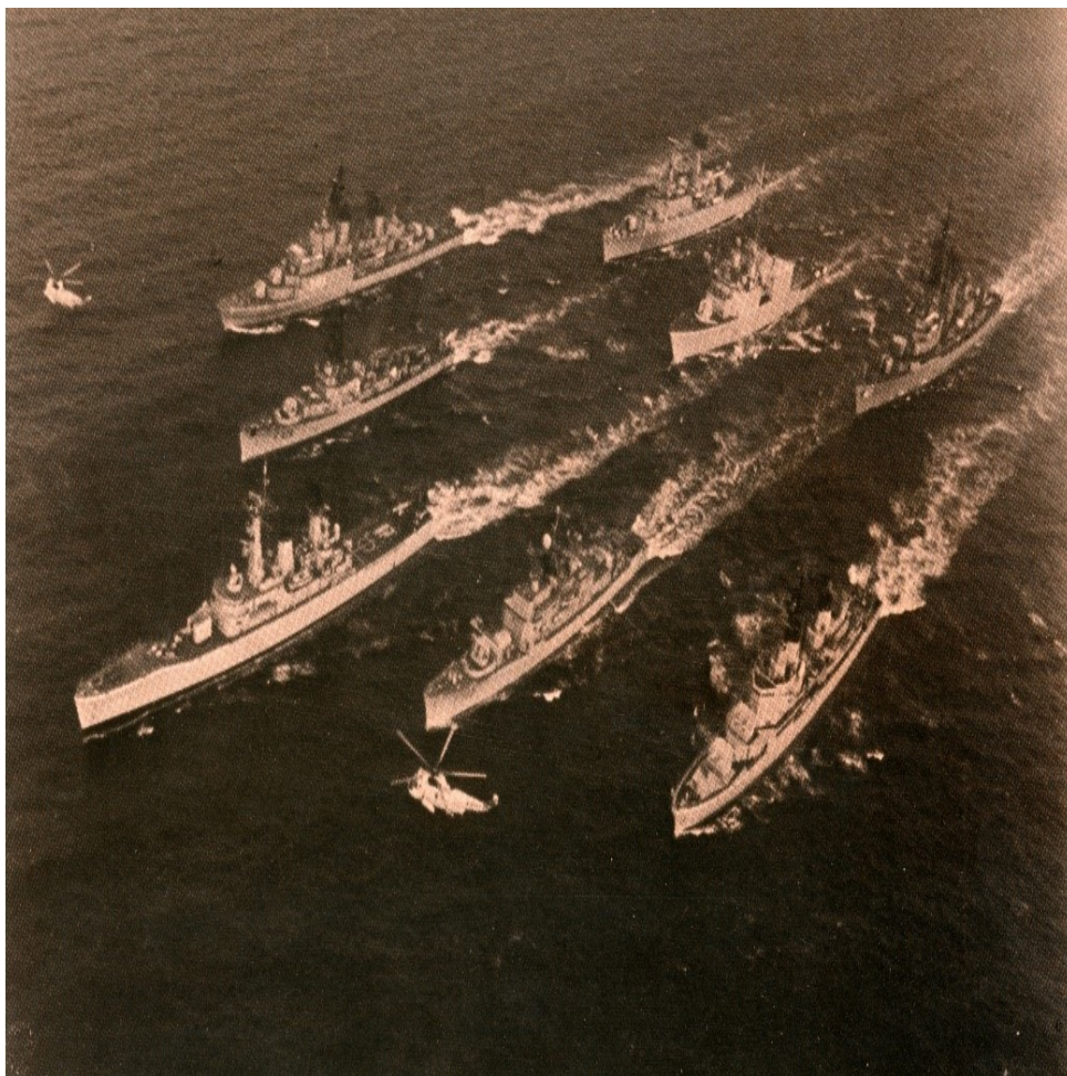
Figura 2 - STANAVFORLANT em 1976, com a fragata Almirante Magalhães Corrêa (segundo navio da esquerda).

Desde então, a Marinha foi participando nesta força naval permanente por períodos de cerca de quatro meses por ano - inicialmente com as fragatas da classe Almirante Pereira da Silva (ver figuras 1, 2 e 3) e, a partir de 1983, com as fragatas da classe Comandante João Belo [2] (ver figura 4). Importa, contudo, referir que, por esta altura (décadas de 1970 e 1980), os compromissos da Marinha no âmbito da NATO não se cingiam à integração na STANAVFORLANT, incluindo também a participação regular em exercícios, como os das séries SUNNY SEAS, OCEAN SAFARI e OPEN GATE.