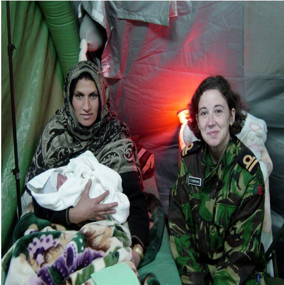
Figura 8 - Apoio médico de ginecologia-obstetrícia, no Paquistão, na sequência do violento sismo que atingiu o nordeste do país, em 8 de outubro de 2005.

Cabe aqui referir que, a partir de 2005, as duas forças navais permanentes da NATO: a STANAVFORLANT e a sua congénere do Mediterrâneo (STANAVFORMED), passaram a designar-se Standing NATO Maritime Groups 1 e 2 (adotando as siglas SNMG-1 e SNMG-2), evidenciando a perda de importância dos critérios e dos vínculos geográficos [3] , em favor de uma utilização indistinta de ambas as forças ao serviço de um conceito alargado de segurança, cujas fronteiras se situavam para além das fronteiras físicas dos aliados.