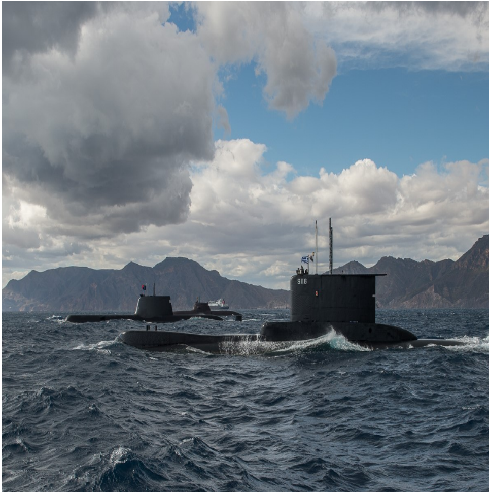
Figura 10 - Submarinos após exercício naval, em 2014, em que participou o NRP Tridente (ao centro), integrado no SNMG-2.

Nesses três anos (2012 a 2014), ambos os submarinos integraram o SNMG-2 e participaram na operação ACTIVE ENDEAVOUR no Mediterrâneo.