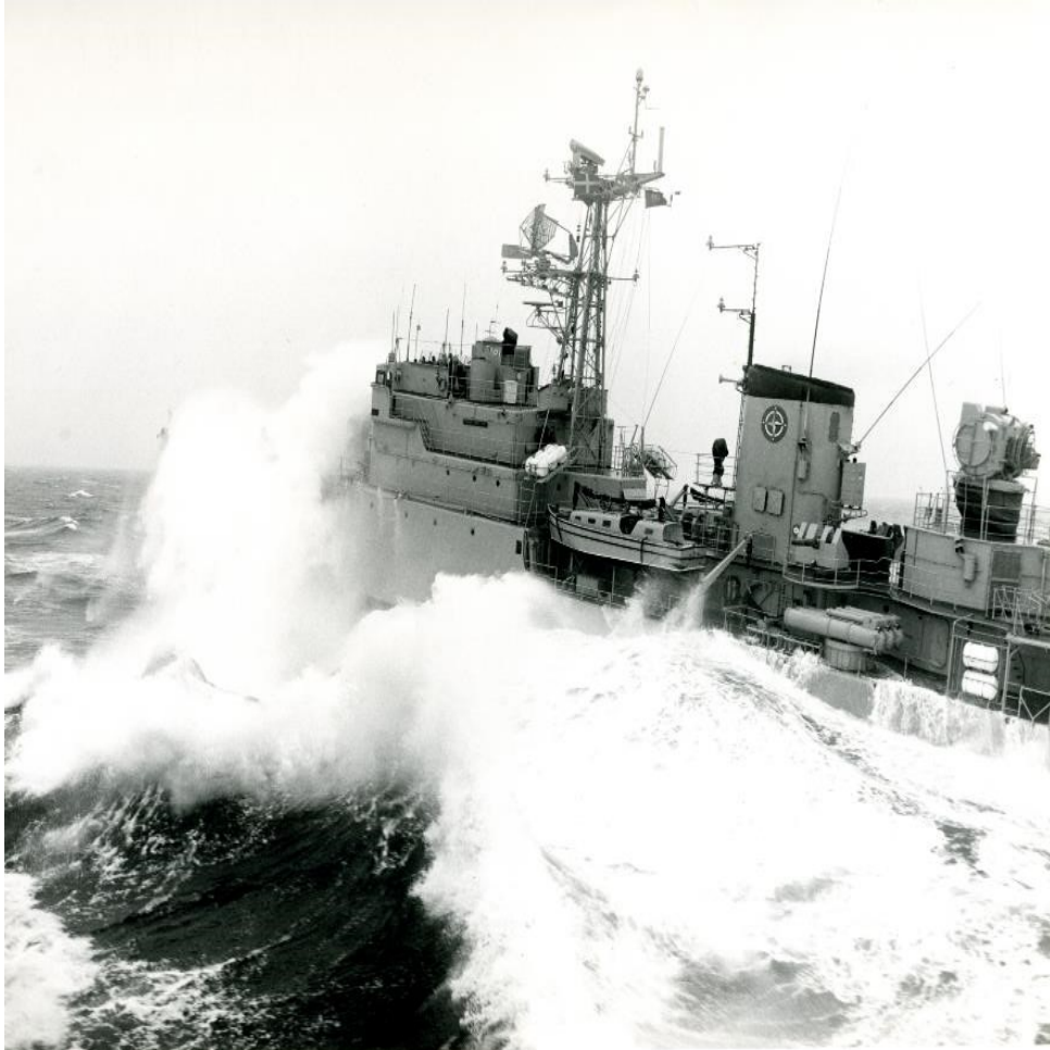
Figura 4 - Fragata Comandante Roberto Ivens , integrada na STANAVFORLANT, num exercício de aproximação para reabastecimento, no Golfo da Biscaia, em 1985.

quer ser pior do que os outros e eu testemunhei, continuamente, as guarnições dos navios menos modernos «darem o litro» para mostrar que conseguiam desempenhos ao nível dos «Rolls Royces». Não sei se estas declarações foram feitas a pensar nas guarnições dos navios portugueses, mas elas assentavam-lhes na perfeição.