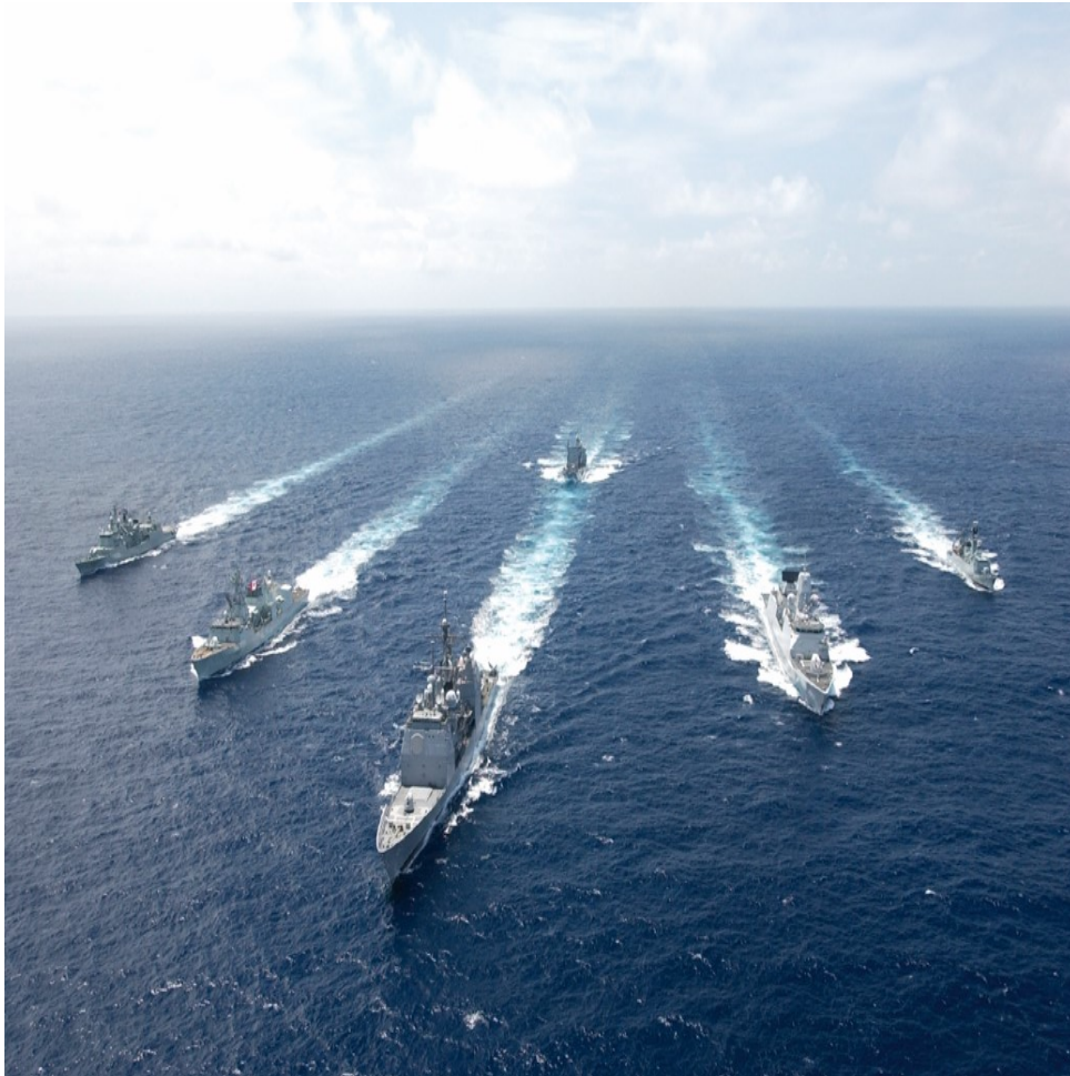
Figura 9 - Fragata Álvares Cabral (à esquerda) integrada no SNMG-1, em 2007.

Contudo, a decisão da NATO no sentido de (em resposta a um pedido da ONU) envolver os SNMG em operações anti-pirataria na área do Corno de África e da bacia da Somália, a partir de finais de 2008, iria constituir o início de sucessivos empenhamentos das forças navais permanentes da NATO em operações de baixa intensidade, com algum descaramento do treino para operações de alta intensidade. Esse envolvimento em operações anti-pirataria começou em outubro de 2008, com a operação ALLIED PROVIDER, à qual sucedeu, a partir de março de 2009, a ALLIED PROTECTOR que, por sua vez, deu lugar à OCEAN SHIELD, entre agosto de 2009 e final de 2016.