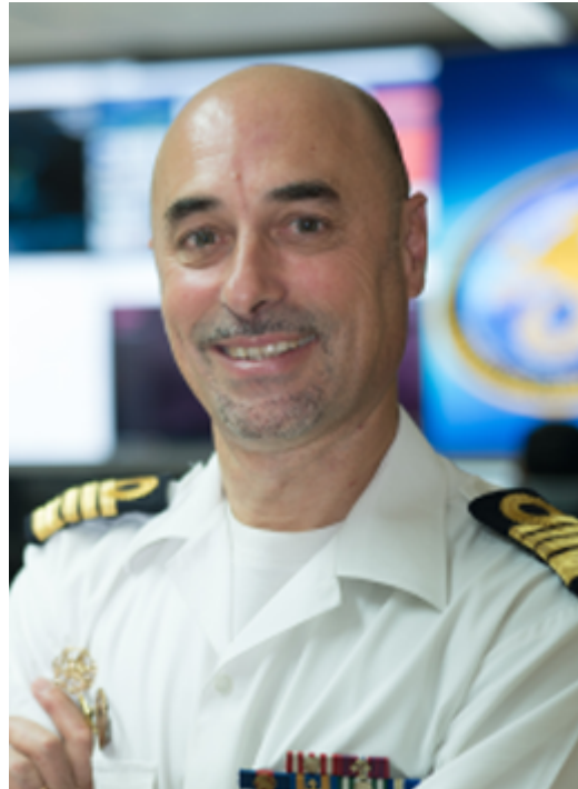
Capitão-de-mar-e-guerra Helder Fialho de Jesus