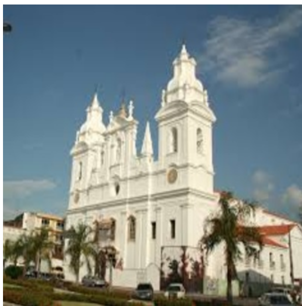
Figura 6 - Catedral da Sé de Belém do Pará, onde está sepultado Pedro Teixeira.

Em S. Luís do Maranhão fez entrega, ao Governador Bento Maciel Parente, dos dados comprovativos da viagem realizada. Tendo em conta os seus serviços, Pedro Teixeira é nomeado Governador e Capitão-Mor do Pará, em 28 de Fevereiro de 1640, cargo que desempenhará até 26 de Maio de 1641. Durante este período foi agraciado pelo Rei Filipe IV (III de Portugal) com o título de Marquês de Aquella Branca.