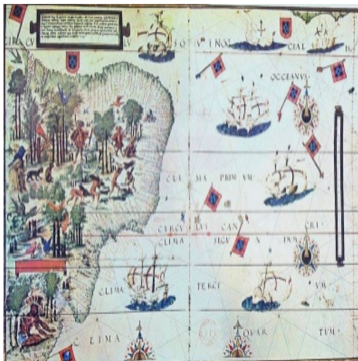
Figura 4 - "Terra Brasilis", Carta de Pedro Reinell e Lopo Homem, 1519.

litoral nordeste do Brasil, tendo, em 19 de Novembro de 1614, defendido o Forte da Natividade, em Guaxinguba, de um ataque gaulês. Tendo estes sido expulsos, em 1615, logo no Natal desse ano, integrou uma expedição comandada pelo Capitão Francisco Caldeira Castello Branco, que deixou São Luís por via marítima, a fim de fundar Belém, após 18 dias de viagem.