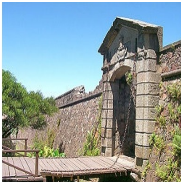
Figura 3 - Porta de Armas na muralha da Colónia do Santíssimo Sacramento.