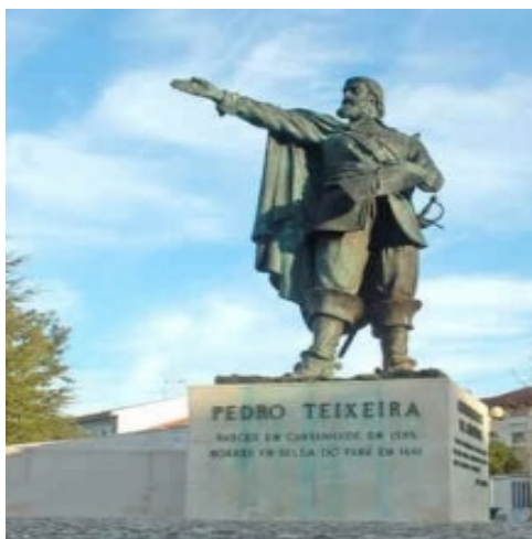
Figura 7 - Estátua a Pedro Teixeira, em Cantanhede.

Tal contrasta com o que se passa em Portugal onde a sua figura é praticamente desconhecida.