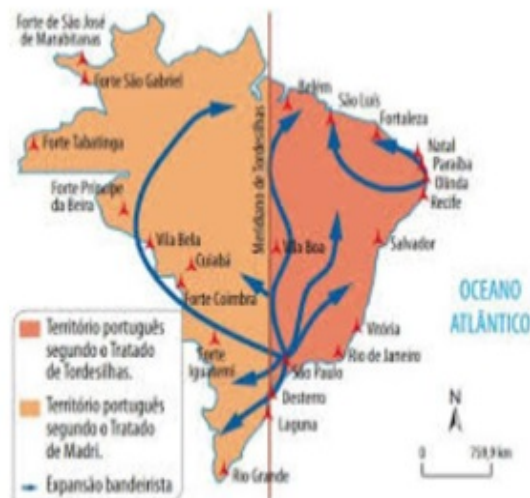
Figura 2 - O Meridiano de Tordesilhas.

Tal facto permitiu que os portugueses passassem a circular livremente a oeste da linha de Tordesilhas, um imenso território praticamente desconhecido, e ainda nas possessões originalmente espanholas. Os habitantes destas possessões no continente sul-americano tinham, por outro lado, muito mais dificuldades em caminhar para norte ou oeste por falta de efectivos e não haver riquezas conhecidas que lhes suscitassem o interesse e, sobretudo, por causa dos obstáculos geográficos existentes.