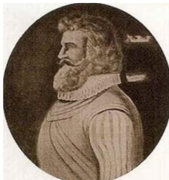
Figura 1 - Pedro Teixeira.

É sabido - mas não suficientemente combatido - como a ignorância sobre o Brasil e nomeadamente a sua História, grassa do lado português, não sendo melhor o que se passa do outro lado do Atlântico relativamente a Portugal. Com a particularidade negativa na parte brasileira, de haver correntes de opinião muito críticas ou desdenhosas da acção dos portugueses em “Terras de Vera Cruz”. Já para não falar das tentativas mais modernas no tempo, de tentar reescrever, desvirtuar e até subverter, toda a História passada. De que a remoção de estátuas é apenas um dos lamentáveis episódios.