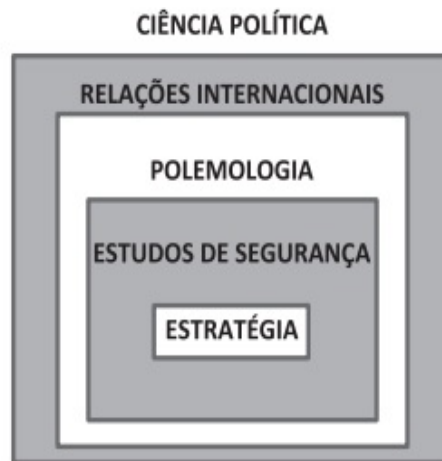
Figura 2 - O lugar da Estratégia.