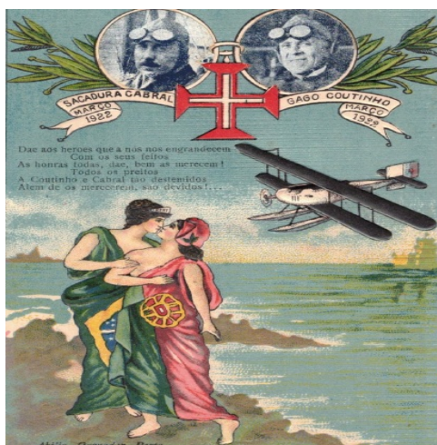
Postal de editor desconhecido, apresentando, ao cima, os retratos laureados dos aviadores, a Torre de Belém e o avião «Lusitânia». Em baixo, as repúblicas irmãs - Portugal e Brasil - abraçam-se. Alguns versos celebram Coutinho e Cabral.

Desse momento, em que os portugueses celebraram o feito de Gago Coutinho e de Sacadura Cabral, participando em massa nas manifestações gratulatórias, alheando-se por algum tempo dos graves problemas com o país de debatia, ficaram os testemunhos escritos e gráficos, e toda uma panóplia de objectos comemorativos. De entre eles, destacam-se os bilhetes postais ilustrados, esses pequenos cartões coloridos que circularam no país e no estrangeiro, levando consigo o orgulho de um povo nos seus novos navegadores.