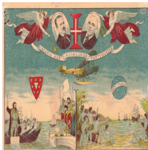
Do editor Monteiro Pereira, este postal apresenta os retratos de Sacadura Cabral e de Gago Coutinho, com a Cruz de Cristo, ladeados de anjos, sob o «Lusitânia». Em baixo, os escudos nacionais dos dois países e cenas da partida de Pedro Álvares Cabral e da sua chegada a terras brasileiras.