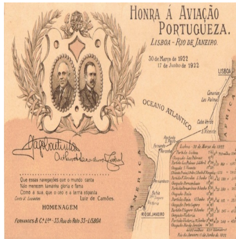
Homenagem da empresa Fernandes & Cia Ltd, de Lisboa. Com os retratos dos aviadores, rodeados de louros, as suas assinaturas autógrafas, e a rota da viagem. De novo, Camões está presente num excerto de Os Lusíadas .