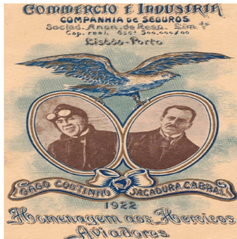
Homenagem aos aviadores, da Companhia de Seguros Comércio e Indústria, com sede em Lisboa e no Porto.