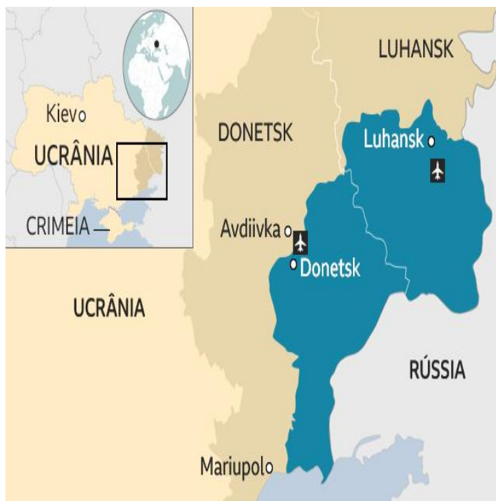
Figura 2 - Regiões de Donetsk e Lugansk.

Paralelamente, na região do Donbass emergiram também movimentos separatistas pró-russos, os quais, apoiados por Moscovo, levaram a Ucrânia a perder o controlo de alguns territórios, nomeadamente de Donetsk e Lugansk. Em concreto, infere-se que o apoio da FR às autoproclamadas Repúblicas Populares teve como objetivo a criação de uma zona tampão com o propósito de proteção da sua fronteira ocidental (figura 2).