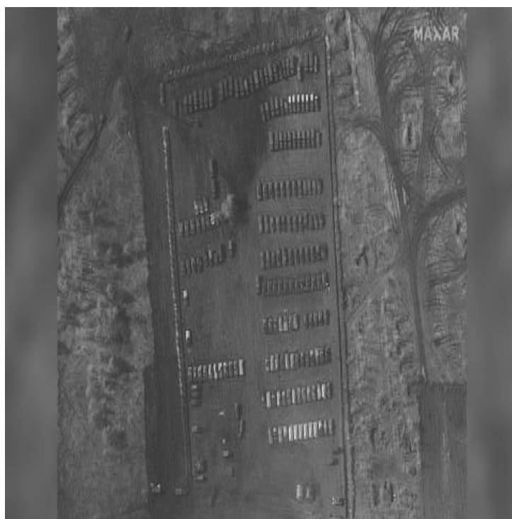
Figura 3 - Imagem satélite do Centro de Treino Pogonovo localizado na região russa de Voronezh.

referentes à presença militar russa, em grande escala, junto às fronteiras da Ucrânia. Entre estas, destaca-se a disseminação de vários produtos de Imagery Intelligence (IMINT) 3 referentes a diversos comboios de blindados russos em deslocação e/ou estacionados em zonas fronteiriças. Como exemplo deste facto, na figura 3 apresenta-se uma imagem satélite, de abril de 2021, do complexo de treino “PogonovoI”, na região de Voronezh, no Oeste da Rússia, onde é possível observar uma elevada concentração de meios de combate russos.