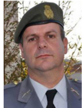
Brigadeiro-general Nuno Correia Barrento de Lemos Pires

Desde 1793 que Portugal lutava contra franceses. Na II Guerra Global Portuguesa 1 tivemos portugueses a combater nas cinco partes do Mundo, do Brasil até Macau, da Ilha de Malta até à Rússia, foram 25 anos em Guerra que só terminou em 1817. No ano da Batalha do Vimeiro, em 1808, a Guerra iniciaria a sua fase mais cruel e decisiva: invadidos, humilhados, pilhados, violentados. Mas foi a Nação, forte e coesa, que se levantou em armas para defender o sagrado chão de Portugal.