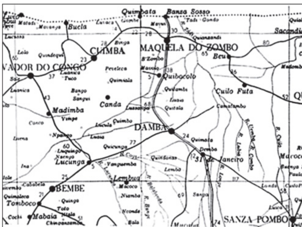
As principais vilas e povoações referenciadas do noroeste de Angola

Entre os Bakongo , povo de origem Bantu (designação aplicada a um grande grupo etnolinguístico negro da África Meridional, constituído por cerca de 150 milhões de pessoas e que vivem ao sul do Saará, com excepção de pigmeus, bosquímanos e hotentotes). O termo bantu é demasiadamente conhecido como significando “homens”, generalização que se refere a povo, população, gente. O singular da palavra é Muntu , de onde se vai buscar o radical Ntu , que é universalmente aplicado pelos cerca de trezentos dialectos espalhados pela África Negra. O que se não refere por norma é que 1º Muntu deve ser traduzido por Pessoa Human ; Ba , por sua vez, tal como foi mencionado, como “povo”, e Ntu finalmente, por cabeça , o que sugere Bantu: povo da frente , e, seja-me permitida a similitude: Bantu “povo escolhido” .