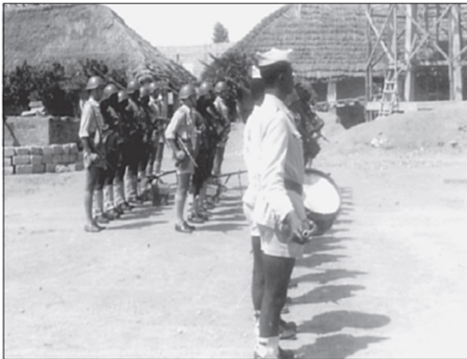
Força de reforço da 5ª Companhia de Caçadores Indígenas, Março 1961

tarde intensificar e sistematizar os “Estudos Africanos”na especialização de estudos Políticos e Sociais.