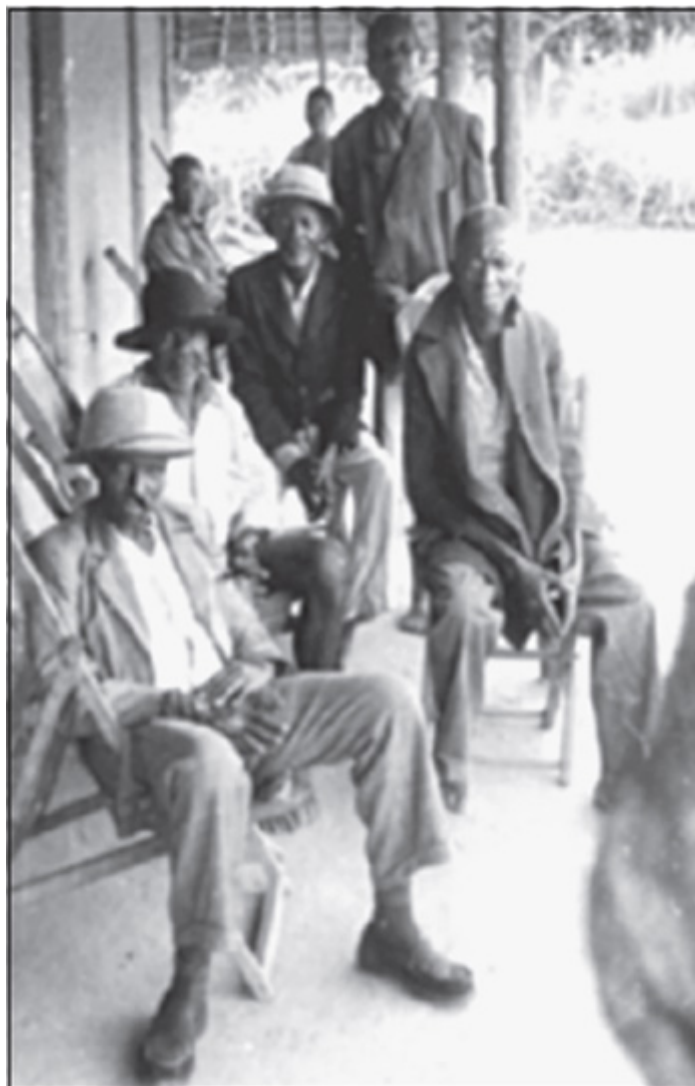
O soba Quilungo é o primeiro da direita (sem chapéu)