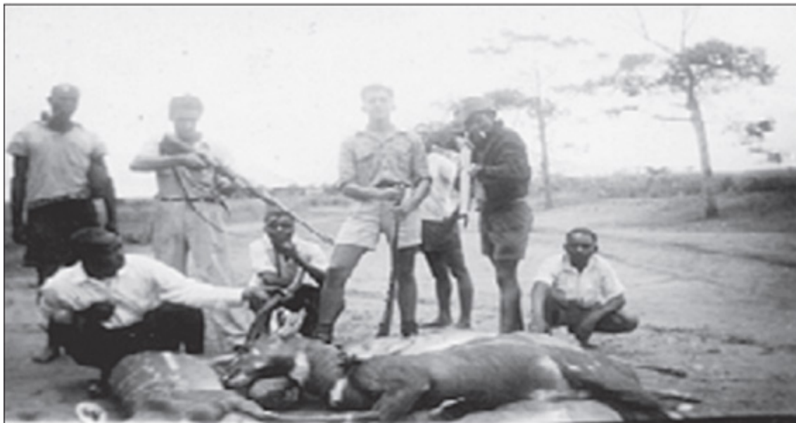
Esta é a única fotografia salva do espólio do Kasengo, em Quibocolo 1957

azo a longas conversas e acesas discussões. A conversa diminui o conflito e a discussão dilui a violência.