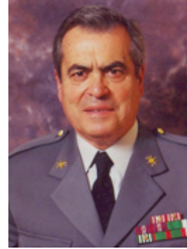
Coronel António de Oliveira Pena