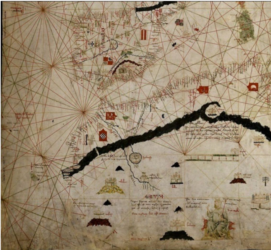
Fig. 3 - Pormenor do portulano de Dulcert, 1339 (Bibliothèque National de France 71 )

que virão a ser representadas nos mapas catalães.