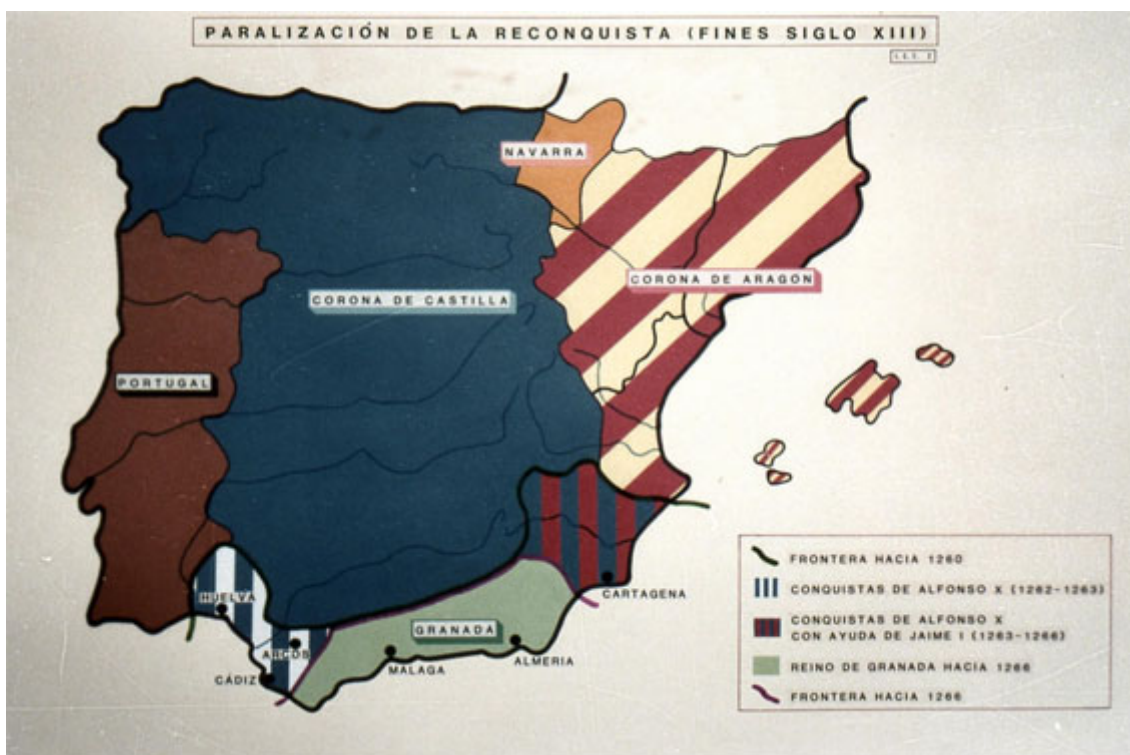
Fig. 2 - Estabilização da reconquista cristã na Península em finais do séc. XIII (A. Ubieto)