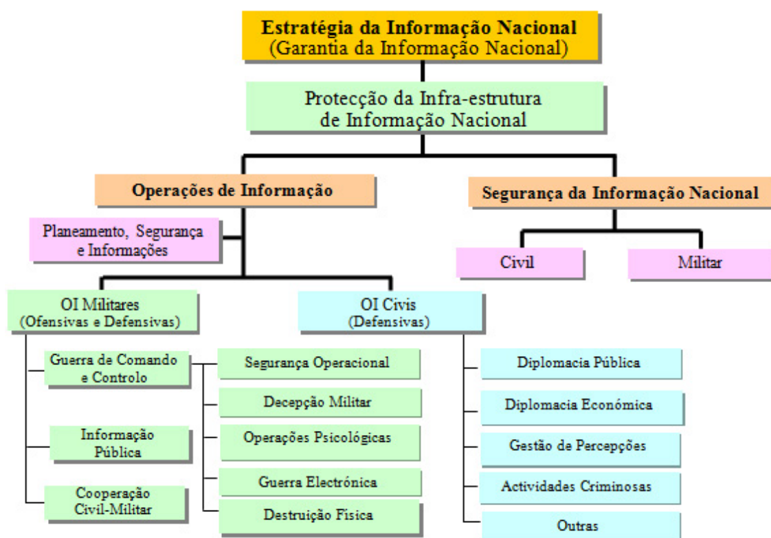
Figura 2 - Modelo de Implementação da Estratégia da Informação Nacional

americano e no modelo adoptado pela Suécia, também se considera que a Segurança da Informação Nacional só pode ser garantida através de um conceito alargado de Protecção da Infra-estrutura de Informação Crítica [38] e que a condução de OI defensivas é decisiva para garantir essa protecção. Partindo do princípio que existe, no contexto do actual ambiente estratégico e económico, uma natural sinergia entre as actividades de Guerra de Informação e a condução de OI, constata-se que, ao nível da sua implementação, a Estratégia da Informação Nacional apresenta duas componentes fundamentais: a condução de Operações de Informação e a Segurança da Informação Nacional.