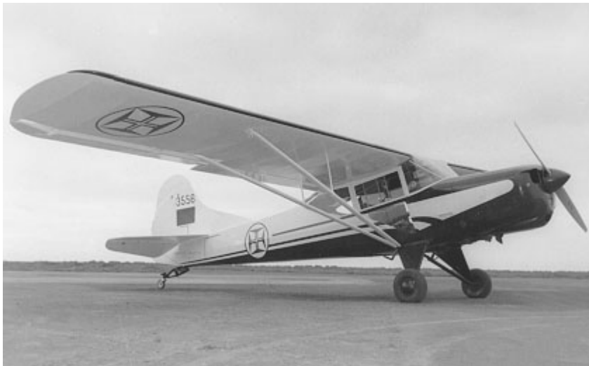
Foto 2. Um Auster no Negage

Xá-Muteba resultou na acalmia duma excitada multidão e salvou muitas vidas. Originalmente a missão era o lançamento do correio, fazendo uma primeira passagem baixa para alertar os habitantes e a segunda para lançar o embrulho no pequeno largo da povoação. Nas suas palavras: “Nesse dia não apareceu gente, mas vi uma extensa mancha de sangue rubra e fresca. Uma olhadela pelos arredores mostrou um grupo que fugia para o capim, qual bando de antílopes. Numa estrada estava um preso, de braços amarrados, entre dois cipaios. Era demais para a nossa curiosidade. No papel de embrulho escrevi: vamos aterrar. Perto havia uma longa faixa de terreno que nos pareceu ser o “campo de aviação” de que a administração falava. Em parte capinado e liso, parecia oferecer condições mais do que suficientes para aterragem e descolagem.