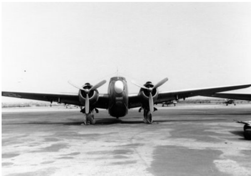
Foto 1. Um Lockheed PV-2 Harpoon em Luanda

Na visão dos rebeldes havia pouco a perder com as suas acções, especialmente porque pensavam que as balas disparadas contra eles se transformavam em água. Por outro lado, as promessas dos militares tinham pouco significado porque sabiam que as decisões importantes eram tomadas em Luanda ou Lisboa [92] .