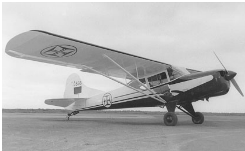
Foto 2. Um Auster no Negage

Xá-Muteba resultou na acalmia duma excitada multidão e salvou muitas vidas. Originalmente a missão era o lançamento do correio, fazendo uma primeira passagem baixa para alertar os habitantes e a segunda para lançar o embrulho no pequeno largo da povoação. Nas suas palavras: “Nesse dia não apareceu gente, mas vi uma extensa mancha de sangue rubra e fresca. Uma olhadela pelos arredores mostrou um grupo que fugia para o capim, qual bando de antílopes. Numa estrada estava um preso, de braços amarrados, entre dois cipaios. Era demais para a nossa curiosidade. No papel de embrulho escrevi: vamos aterrar. Perto havia uma longa faixa de terreno que nos pareceu ser o “campo de aviação” de que a administração falava. Em parte capinado e liso, parecia oferecer condições mais do que suficientes para aterragem e descolagem.