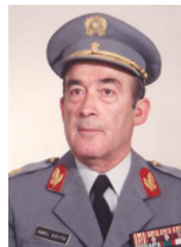
Tenente-general Abel Cabral Couto