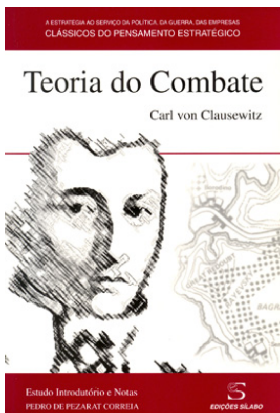
Teoria do Combate Carl von Clausewitz

Tenente-General. Sócio Efectivo e Vogal da Direcção da Revista Militar