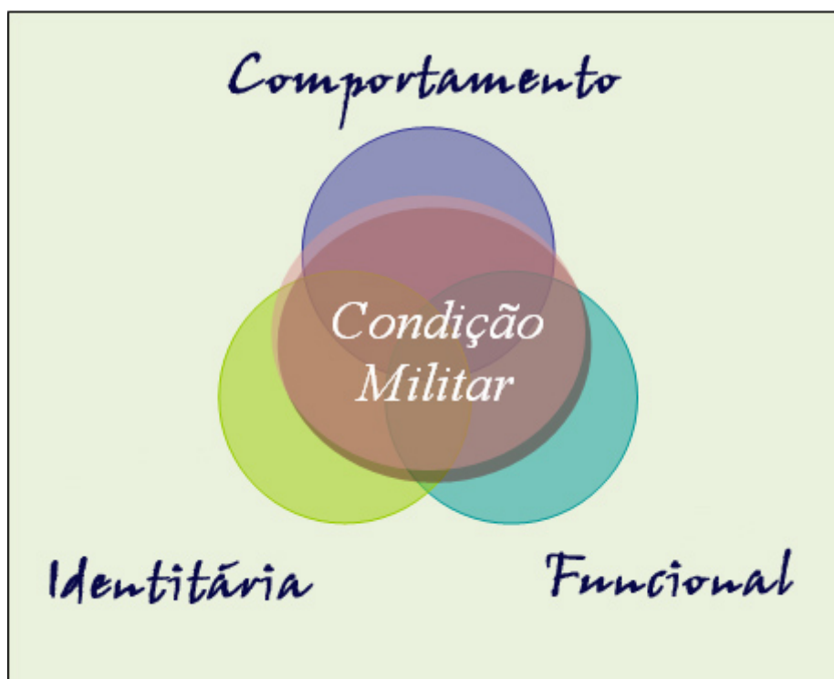
Figura 2: Papel regulador da Condição Militar

A perspetiva funcional, pela natureza da atividade militar, liga, de forma operacional, as dimensões “Organização” e “Instituição” e é um reflexo do tipo de identidade criada e da tipologia de comportamentos mais valorizados, sendo que nas ações e realizações se assume que é tão importante “o que se faz” como “a forma como se faz” e “porque se faz”. Ou seja, não basta fazer bem o que deve ser feito (juntando a eficácia e a eficiência), é necessário também que o que se faz aconteça “pelas razões certas”.