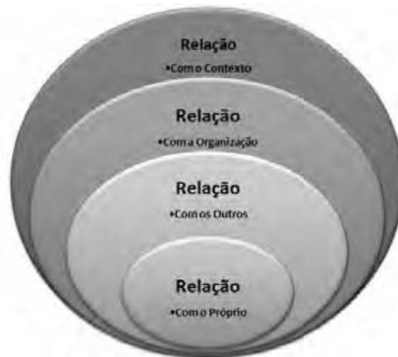
Figura 3: Dimensões a ponderar na formação comportamental

A “relação com o Próprio”, ou a dimensão intra-individual, é um aspeto que reportamos de importante no que concerne à formação comportamental dos militares e à qual, em nosso entender, nem sempre é dada a devida importância. Isto porque, nesta dimensão, onde tudo começa, poderá haver a necessidade de ser definido com maior precisão o locus estatutário e funcional do indivíduo na organização militar, inicialmente perante ele próprio (a sua vocação e as suas convicções, em cada momento) e depois em relação às outras dimensões, designadamente, em relação aos contextos em que atua (como se desempenha). Para isso, deverão ser particularmente valorizadas as vertentes cognitiva e emocional e a preparação intra-individual em termos de autoconfiança, autorregulação, locus de controlo interno e autoeficácia, aspetos essenciais a um bom desempenho individual, sobretudo se estiverem envolvidas certas características particulares do contexto militar (e.g., como poderá acontecer em campanha ou em situações de guerra). Será ainda no âmbito desta dimensão intra-individual que fará mais sentido refletir sobre o conceito de “autoaprendizagem”, o qual deverá merecer ser tratado de forma diferente e ser mais valorizado ao longo do percurso profissional pelo sistema de gestão de recursos humanos.