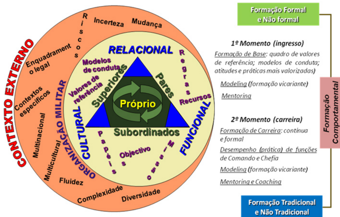
Figura 5: Modelo teórico da Formação Comportamental: Contexto externo, contexto organizacional e Componentes Formativas