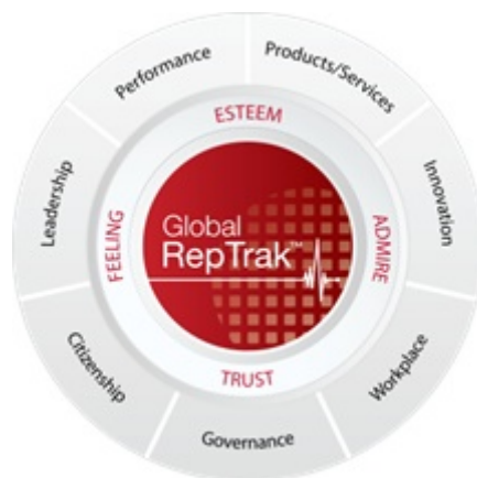
Figura 2 - Modelo RepTrak TM

Em 2006, um novo modelo RepTrak TM (Figura 2) foi reconhecido e aceite pela comunidade profissional depois de ter sido utilizado num estudo multinacional (Aleknonis, 2010). O RepTrak TM tem sete dimensões e um total de 23 atributos (Tabela 1).