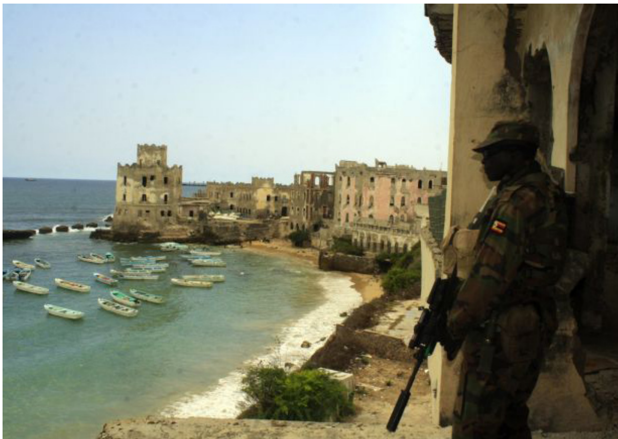
Figura 4 - Soldado da AMISOM vigia o porto, em Mogadiscio

Atualmente, “Gashendiga”, proposto como futura localização do Ministério da Defesa somali e QG das SNAF não está ocupado, nem controlado, por forças somalis, e estima-se que levará mais alguns meses até que isto se torne uma realidade. Assim, para um futuro próximo, as duas localizações restantes são as mais relevantes, pois o treino militar que envolve a maioria dos formadores europeus desenvolve-se no JTC, existindo uma pressão para o incremento das instalações relacionadas com a segurança, de forma a diminuir o risco de um atentado pela AS. Estes assessores (em várias áreas, num total de dezasseis) estão já em Mogadiscio, mas, ainda, sem condições de operar, pois as viaturas “MAMBA”, que irão permitir o deslocamento entre o MIA e as outras localizações, onde se processa a formação/mentoria, ainda não funcionam. O programa de preparação e coesão para os assessores iniciou-se em julho de 2013 e, desde aí, prepara-se a transição para a Fase 3 da missão e o alcançar do DP4.