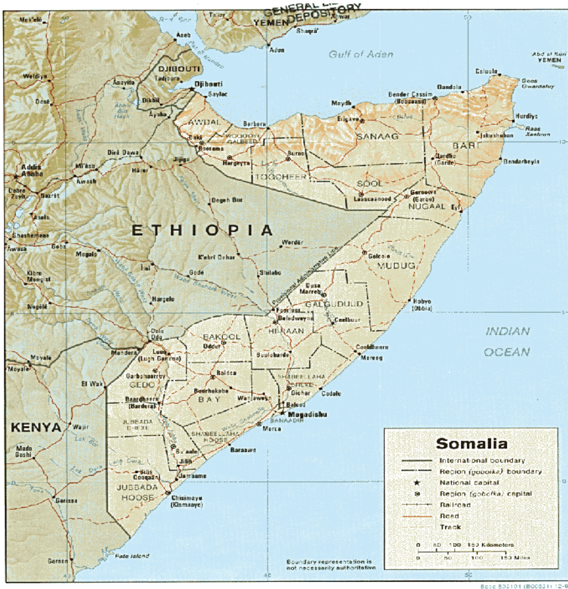
Figura 1 - Mapa da Somália

Os cerca de 240 km de estrada entre Baidoa e Mogadíscio estão agora também sob controlo das forças militares afetas ao Governo Somali, contando com o imprescindível apoio da AMISOM, notando-se um fluxo dos insurgentes (principalmente da AS, mas também de grupos marginais) para as regiões mais montanhosas a norte, permitindo-lhes ainda uma razoável capacidade operacional no país. Enfraquecida pela perda de alguns pontos fortes, nomeadamente, na região de Mogadíscio, a AS voltou o seu “modus operandi” para táticas de guerrilha e adotou um modo mais flexível de recolher e disseminar informação provenientes das várias frentes do conflito.