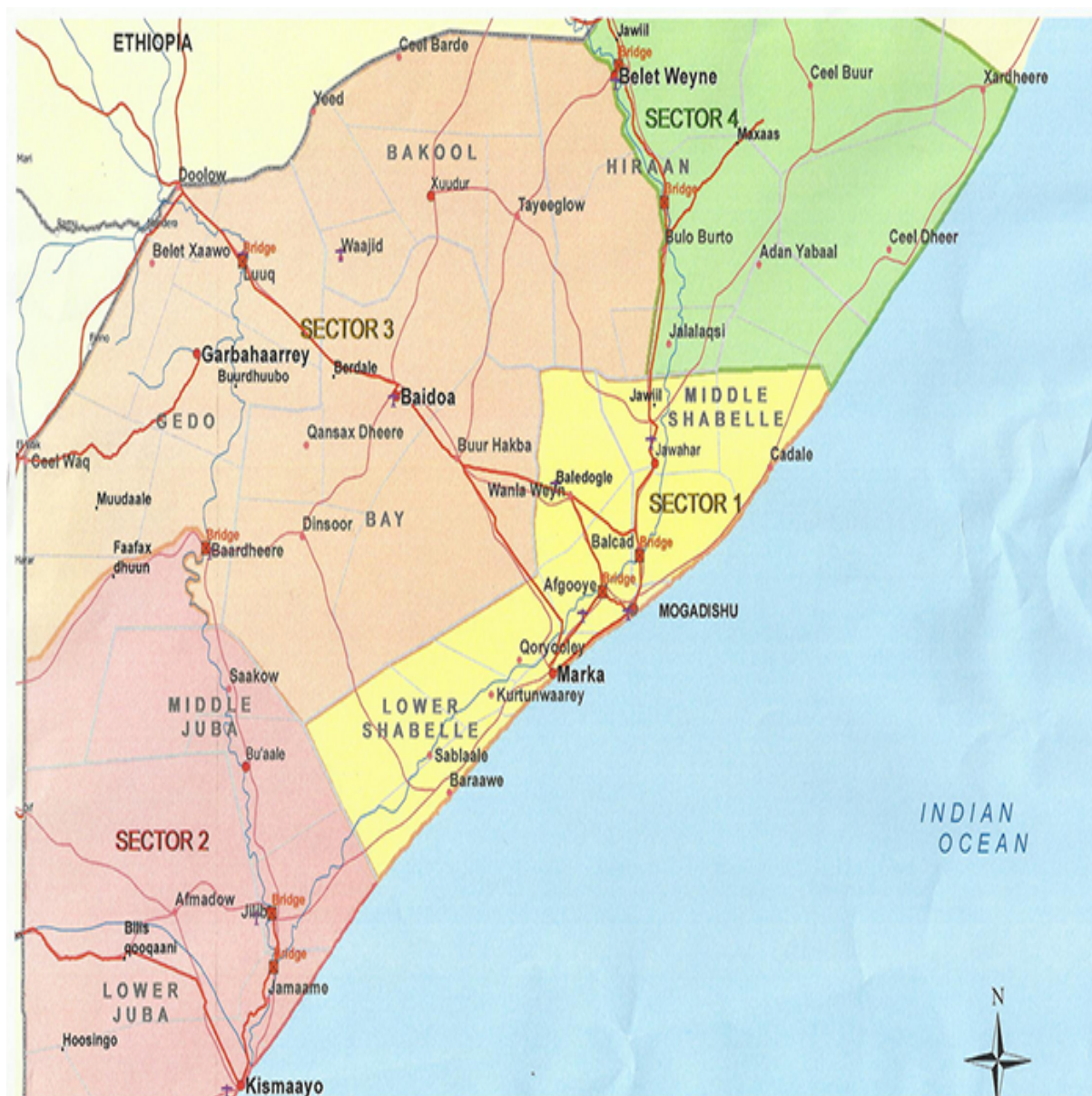
Figura 2 - AMISOM - Sectores Operacionais

necessárias para garantir assistência humanitária às populações e apoiar o Governo da Somália no alargamento da autoridade do Estado às áreas recentemente recuperadas à AS.