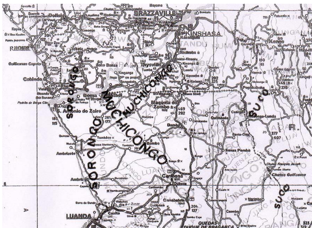
Figura 2 - Distribuição dos povos do Norte de Angola