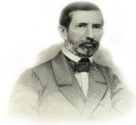
Figura 6 - Teófilo Ottoni