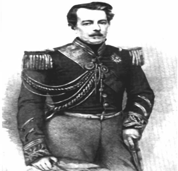
Figura 7 - Brigadeiro Luís Alves de Lima e Silva, Barão de Caxias

A notícia da derrota dos revoltosos paulistas, no entanto, arrefeceu o ânimo dos liberais mineiros e dividiu a opinião de seus líderes sobre a viabilidade de Ouro Preto. Buscando ocupar uma posição mais segura, os revoltosos seguiram para Lagoa Santa, onde se entrincheiraram, após terem sido cercados pelas forças imperiais no arraial de Santa Luzia.