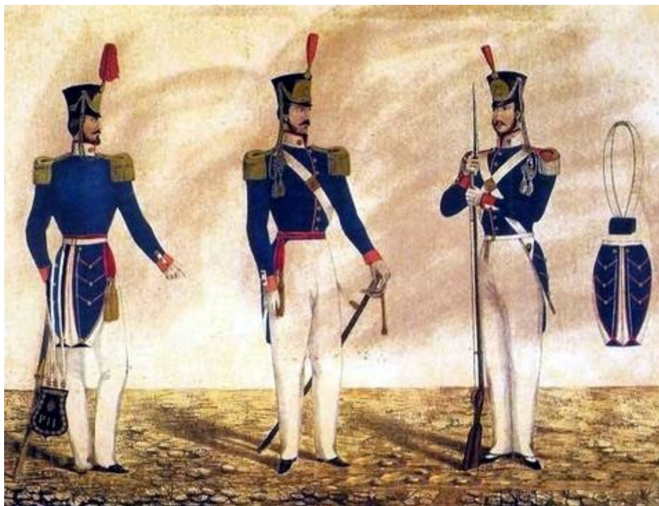
Figura 1 - Soldados do Exército Imperial brasileiro em 1842

Mesmo idoso e doente, Feijó deslocou-se para Sorocaba - então denominada capital provisória da província - sendo recebido por Tobias de Aguiar. Juntos, os dois líderes rebeldes começaram a escrever um jornal revolucionário, O Paulista , de tom arrogante, violento, e trazendo grave ameaça de separatismo.