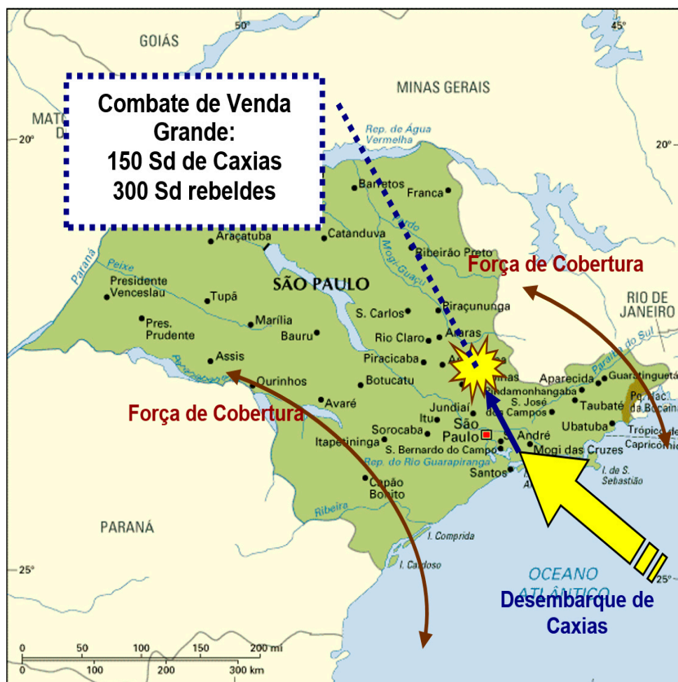
Figura 5 - Ação de Caxias contra os Liberais em São Paulo

As forças revoltosas foram eliminadas antes da marcha planejada sobre São Paulo. Rafael Tobias de Aguiar tentou fugir para o Rio Grande do Sul, tentando unir-se aos Farrapos, mas foi capturado e levado ao Rio de Janeiro [9] . Caxias tomou a cidade de Sorocaba e ali prendeu o Padre Feijó que assumira, após a fuga de Tobias de Aguiar, o exercício da “presidência” da província. A troca de mensagens entre ambos é interessante, pois Caxias havia atuado sob as ordens de Feijó quando este era Ministro da Justiça e depois Regente.