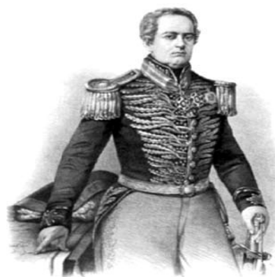
Figura 4 - Coronel Rafael Tobias de Aguiar

Sob o comando do Major Francisco Galvão de Barros França, foi constituída a Coluna Libertadora , com efetivo de, aproximadamente, 1.500 homens, para marchar até a capital