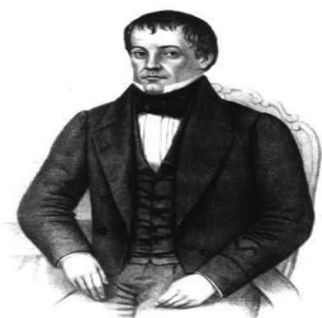
Figura 2 - Senador Padre Diogo Feijó

Mesmo idoso e doente, Feijó deslocou-se para Sorocaba - então denominada capital provisória da província - sendo recebido por Tobias de Aguiar. Juntos, os dois líderes rebeldes começaram a escrever um jornal revolucionário, O Paulista , de tom arrogante, violento, e trazendo grave ameaça de separatismo.