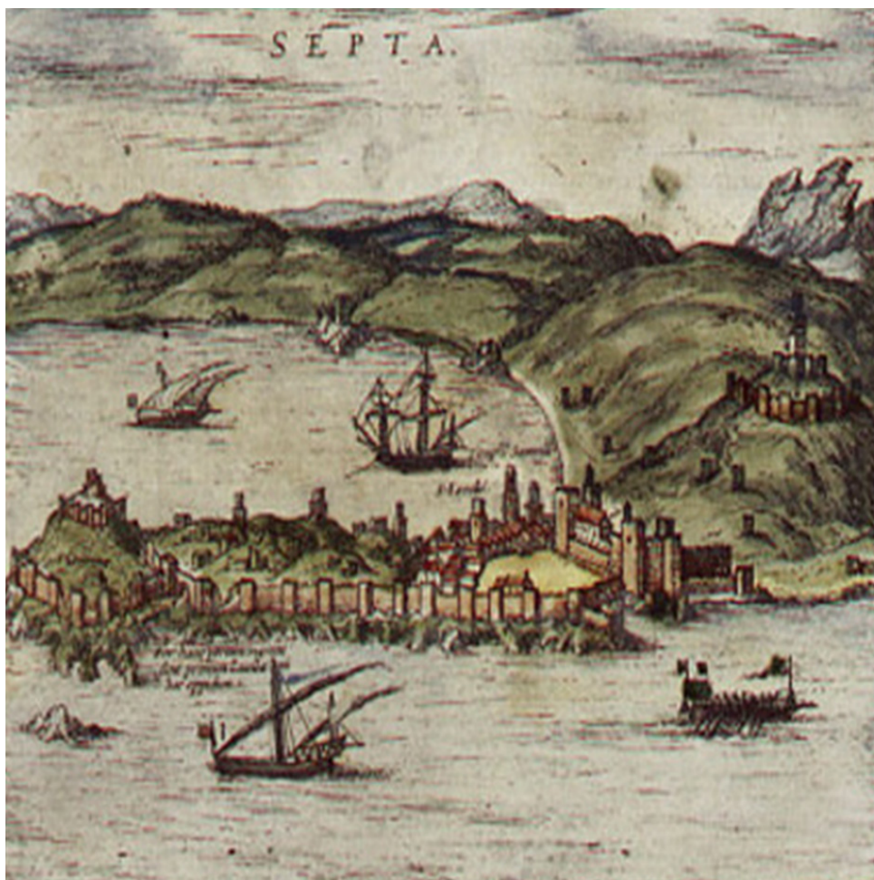
Figura 5 - Ceuta no séc. XV (in Civitates Orbis Terrarum )

5. Um conjunto de Factores Diversos : foi importante à empresa. Nele devem ser considerados o espírito guerreiro e aventureiro da nobreza e de outros estratos do povo, não só inerentes ao espírito da cavalaria, como também à memória ainda viva das lutas recentes com Castela. Os filhos do rei, homens de grande estofa moral e intelectual, aspiravam a grandes feitos e ainda não tinham sido armados cavaleiros, o que veio a acontecer a três deles (D. Duarte, D. Pedro e D. Fernando), após a conquista de Ceuta.