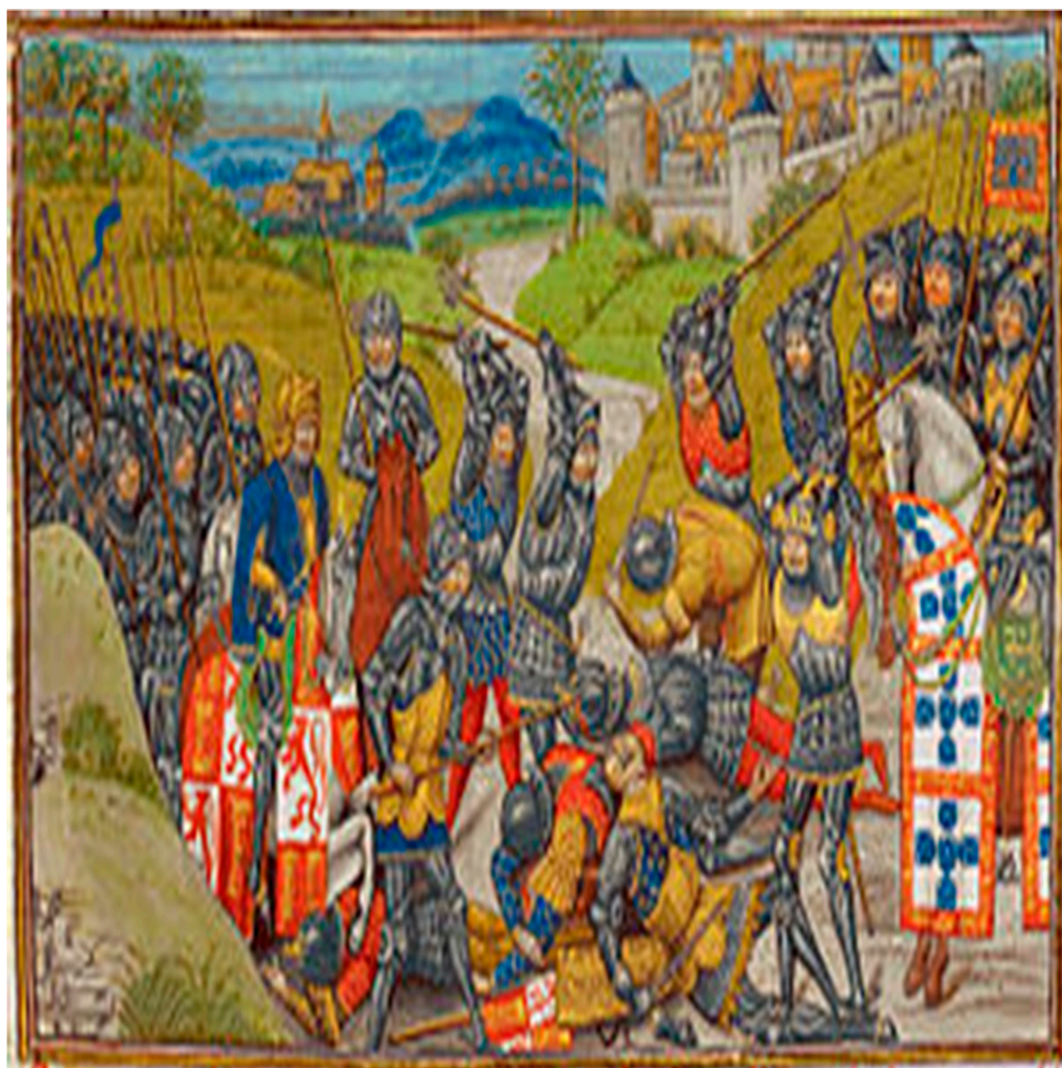
Figura 2 - O génio militar de Nuno Álvares Pereira foi decisivo na Batalha de Aljubarrota

Crise que se prolongou desde 1383 a 1385 e que foi finalmente resolvida politicamente, através da eleição do Mestre de Avis para Rei, em 1385, nas Cortes de Coimbra, onde pontuou o Dr. João das Regras; e, militarmente, através de toda uma campanha militar que culminou em Aljubarrota e Valverde, onde se agigantou a figura do Condestável D. Nuno Álvares Pereira, a quem os portugueses ficaram, indubitavelmente, a dever a sua independência.