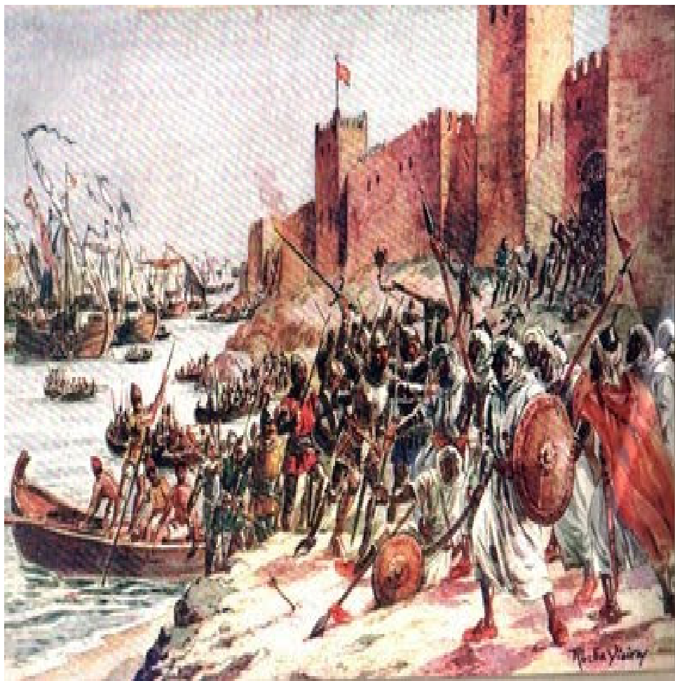
Figura 9 - Figuração do desembarque em Ceuta - 1415

- Garantia do comércio com o Norte da Europa, onde já possuíamos uma Feitoria em Bruges, e com o Mediterrâneo, onde se destacavam as repúblicas italianas. Do mesmo modo, foi reconhecida a importância da posição geográfica do país e dos seus portos para o comércio internacional. Desenvolveram-se, em especial, os de Lisboa e Porto, com a criação de alfândegas, confrarias de artesãos e mercadores, e outros;