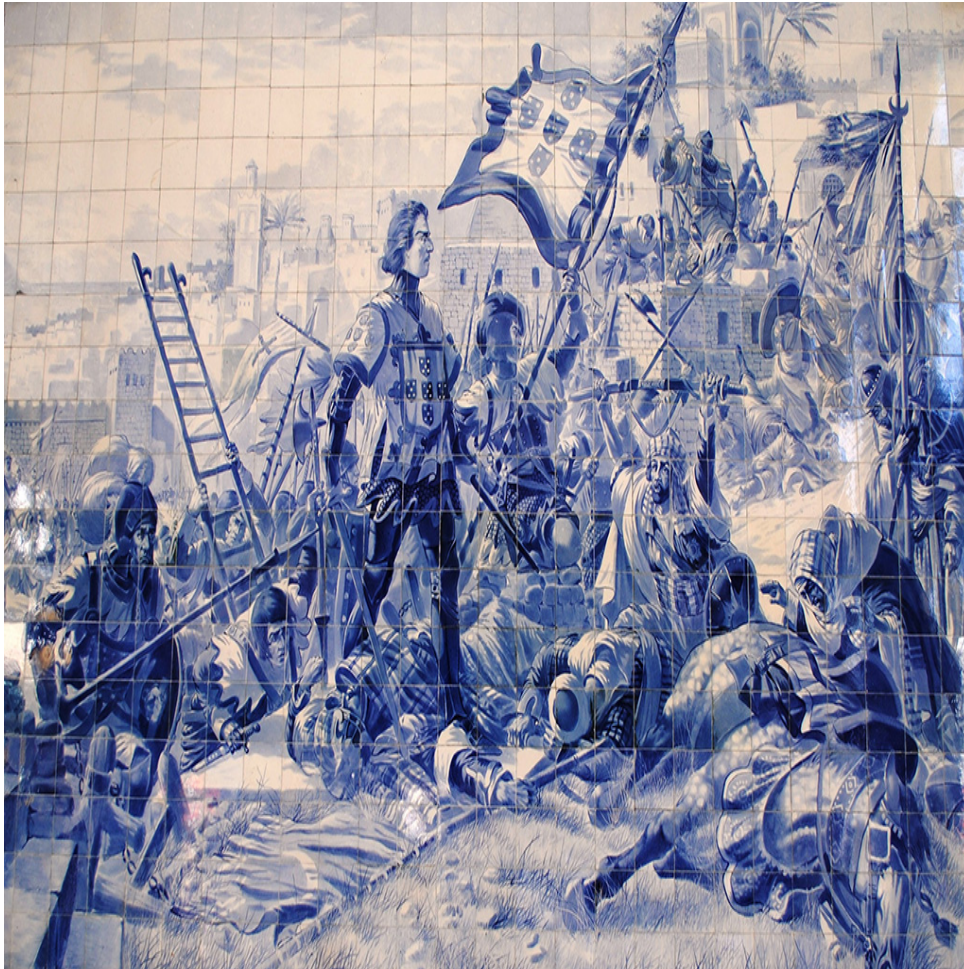
Figura 10 - A conquista da Praça (azulejos - Estação de São Bento, no Porto)

Em resumo, D. João I preocupava-se, fundamentalmente, em conseguir um equilíbrio geopolítico vantajoso para Portugal, que lhe permitisse minorar vulnerabilidades e alargar as suas potencialidades através da exploração que o Atlântico Sul oferecia. Garantia-se, assim, o acesso a duas regiões fundamentais do comércio, uma a Norte e outra no Mediterrâneo, e a manutenção de um ponto de força militar a Sul, que era também um foco de pressão sobre a Península. Esta ideia de aproveitar o Atlântico como elemento de Poder é um dado novo para a época e é obra dos portugueses.