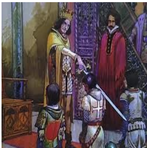
Figura 7 - D. João I arma os filhos cavaleiros

Assim se concluiu aquele que se considera o primeiro passo na expansão ultramarina portuguesa.