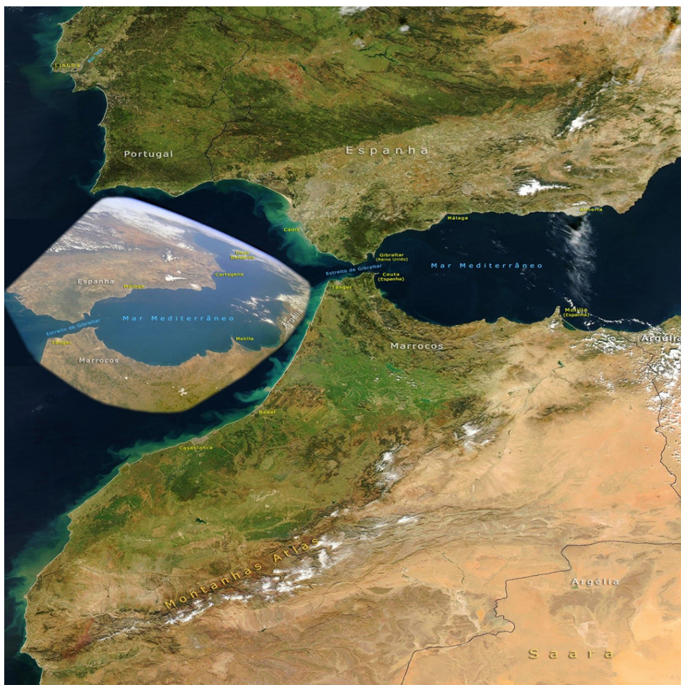
Figura 11 - O Estreito de Gibraltar

Por sua vez, a “Escola Henriquina”, sem pôr em causa as ligações às outras nações europeias, privilegiava a expansão ultramarina como forma de contrabalançar o poder castelhano (mais tarde, espanhol), a fim de manter a paz na Península.