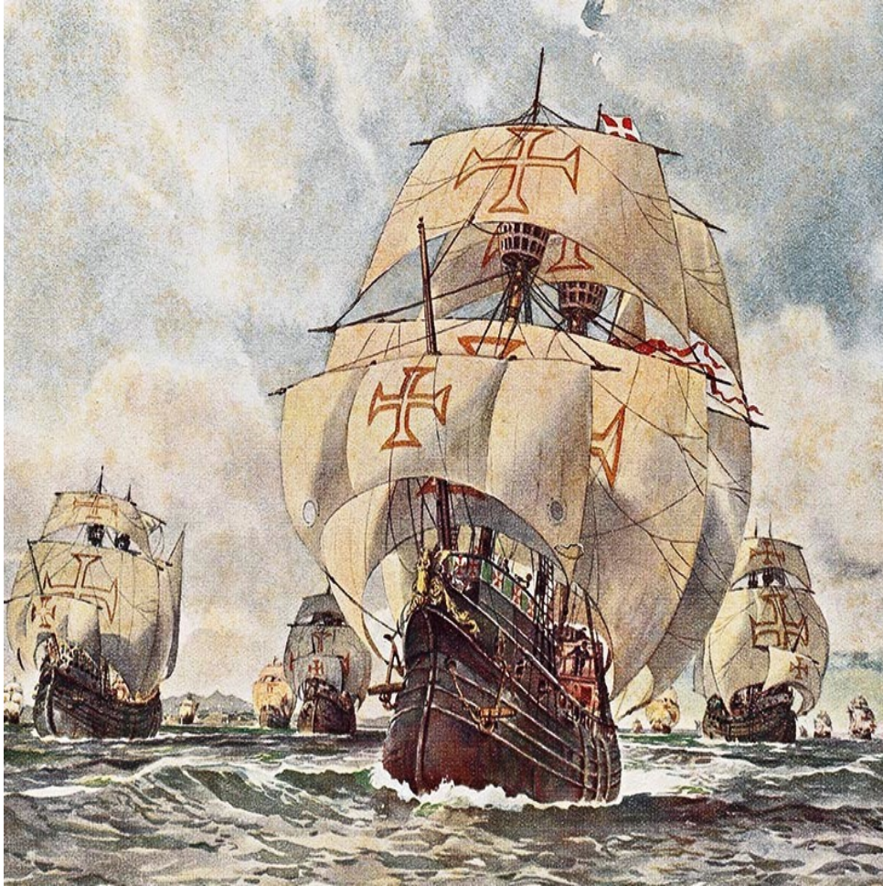
Figura 1 - Ordem de Cristo, 1319-1834

Hábil diplomata, a que aliava dotes de estratégia e conhecimentos da arte militar, negociou tratados de modo a evitar um grande envolvimento de Portugal nas contendas dos restantes reinos da Península. O reinado ficou ensombrado apenas pelas lutas com seu filho e sucessor, que não conseguiram, no entanto, prejudicar a obra realizada.