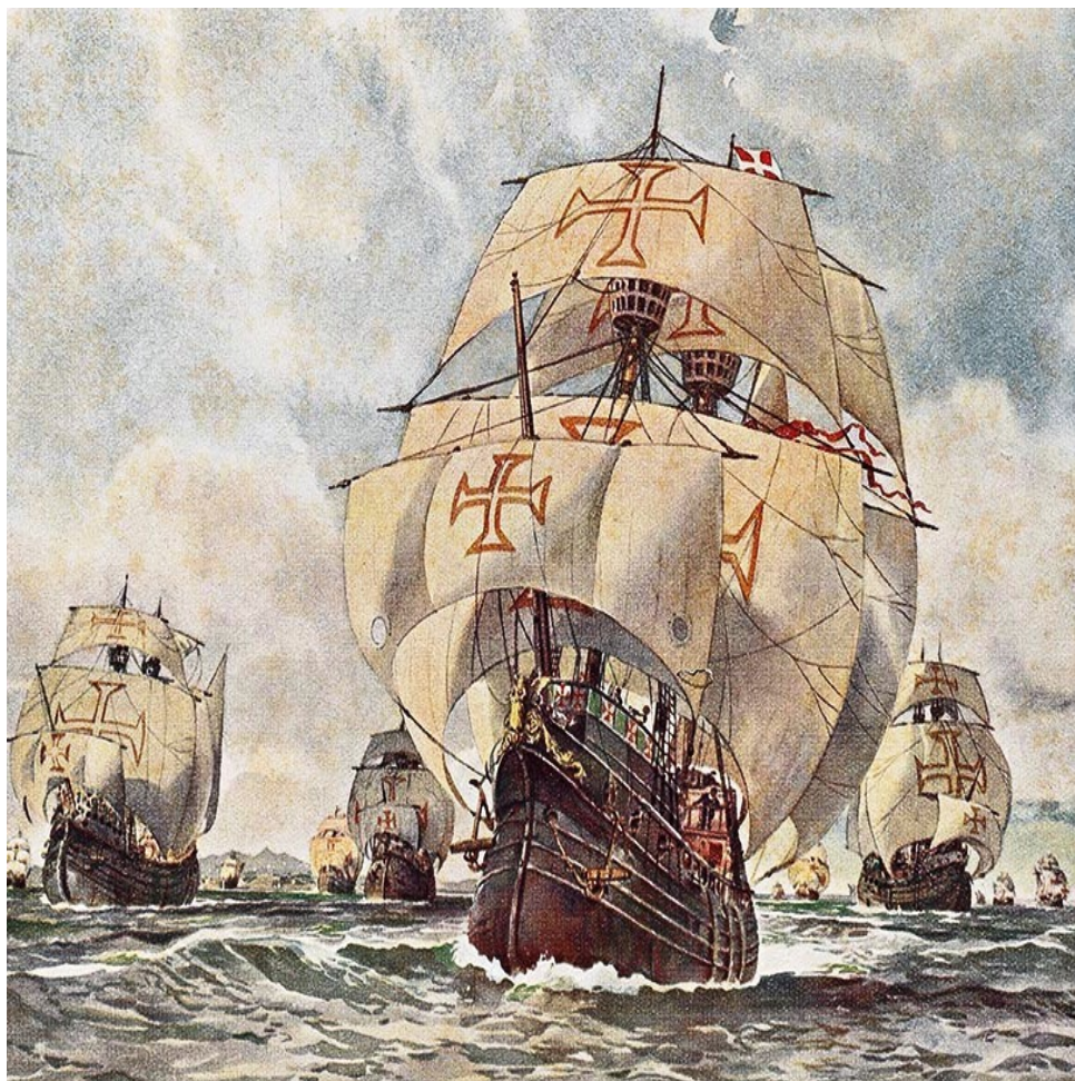
Figura 1 - Ordem de Cristo, 1319-1834

Hábil diplomata, a que aliava dotes de estratégia e conhecimentos da arte militar, negociou tratados de modo a evitar um grande envolvimento de Portugal nas contendas dos restantes reinos da Península. O reinado ficou ensombrado apenas pelas lutas com seu filho e sucessor, que não conseguiram, no entanto, prejudicar a obra realizada.