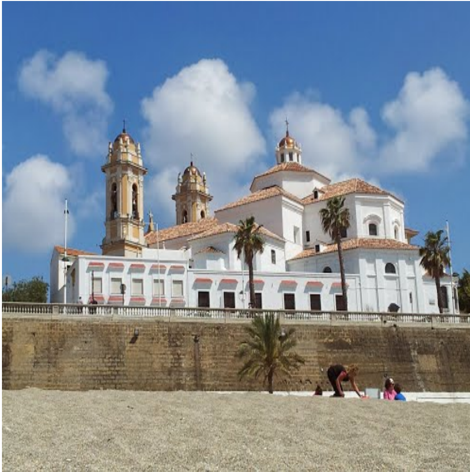
Figura 6 - A Catedral de Ceuta

Tudo que era gente importante no reino embarcou na armada. Esta escalou Lagos e, após um episódio que poderia ter deitado tudo a perder [16] , aportou a Ceuta em 21 de Agosto, tendo-a tomado de assalto no dia seguinte.