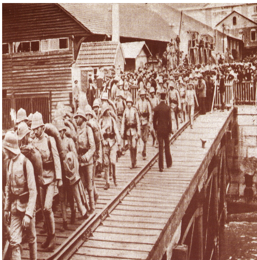
Figura 5 - Portugal na I Guerra Mundial

No final do século XIX e princípio do século XX, nomeadamente, em 1898, 1913 e 1938, algumas potências europeias negociaram secretamente a partilha dos territórios africanos portugueses, na tentativa de resolverem os seus conflitos à nossa custa. No entanto, nenhuma destas congeminações teve consequências.