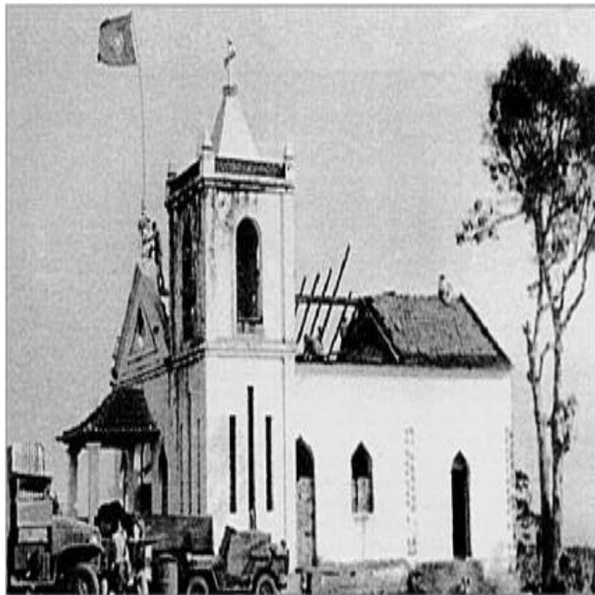
Figura 6 - Chegada do Batalhão 96 a Nambuanguo - 9 de agosto de 1961

A luta para eliminar estas “bolsas móveis”, reforçadas do exterior, durou catorze anos e estava quase concluída em 1974.