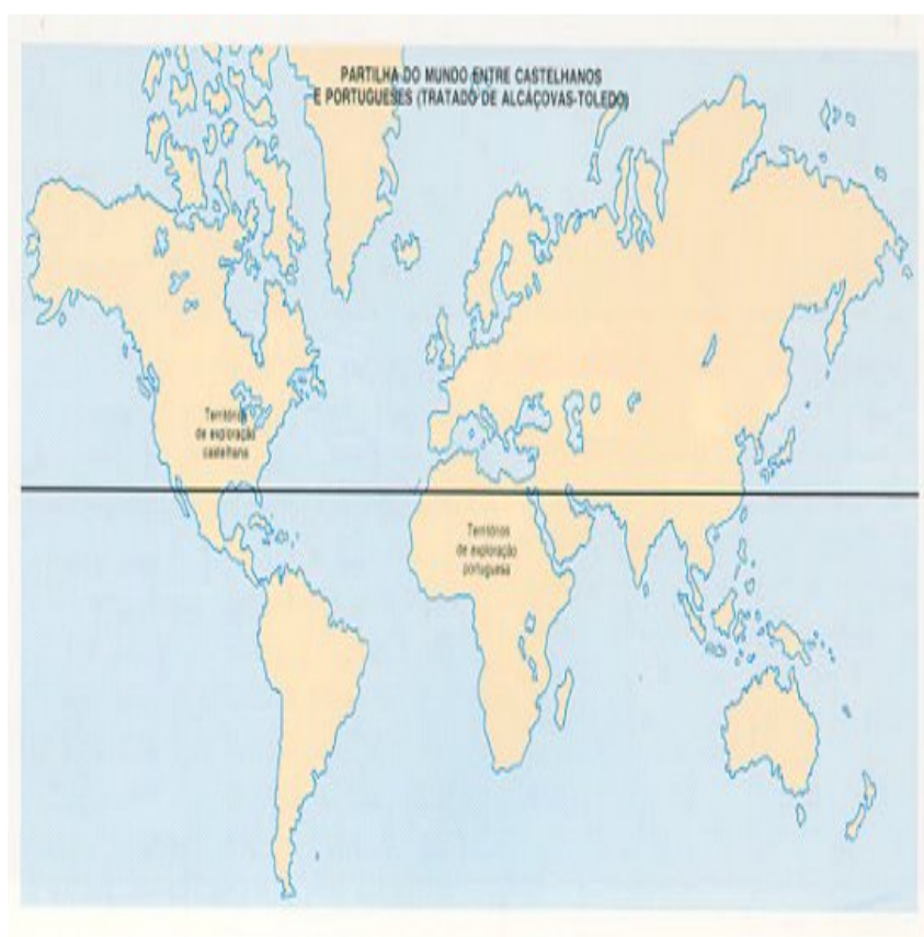
Figura 1 - Tratado de Alcáçovas - 1479

Ao começar a sentir-se a concorrência espanhola, apesar de os portugueses terem já desenvolvido a tese do "mare clausum" , que obteve o sancionamento da Santa Sé, assinou-se o Tratado de Alcáçovas, em 1479, e, mais tarde, o Tratado de Tordesilhas, em 1494, manobra magistralmente conduzida por D. João II, que dividiu o mundo em dois hemisférios, um português e outro espanhol, afastando estes, definitivamente, do caminho da Índia.