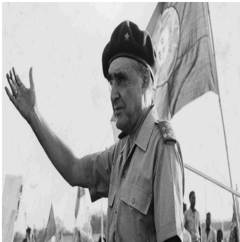
Figura 8 - O General António de Spínola