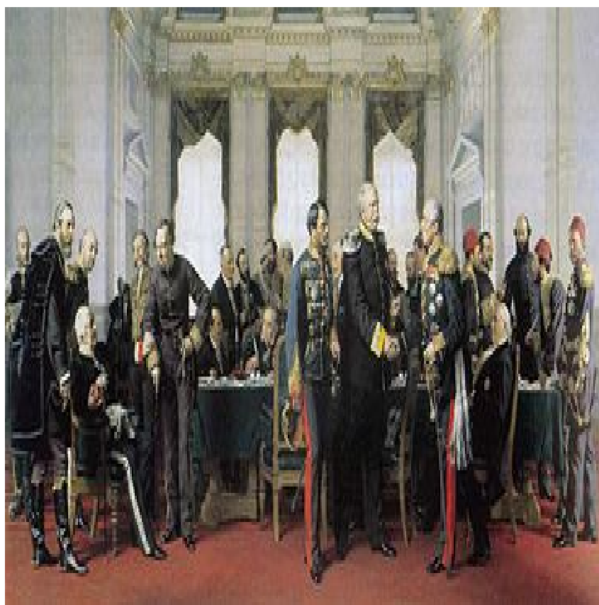
Figura 3 - Conferência de Berlim - 1884/5

Esta corrida a África culminou na Conferência de Berlim, em 1885. Tal conferência, destinada a “repartir” a África, estabeleceu que os direitos históricos não eram suficientes e que para se ter direito a um território era preciso ocupá-lo efectivamente, quer dizer, militarmente. Portugal, que em África ocupava, de um modo geral, apenas as costas dos territórios onde se estabelecera, foi um dos principais visados com esta medida.