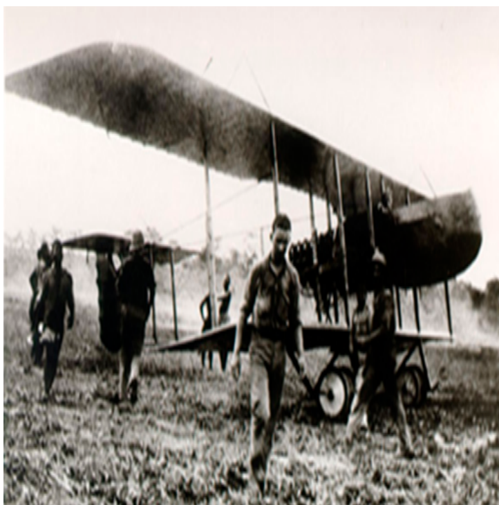
Figura 2 - Os FARMAN F-40 , no Norte de Moçambique - 1917/1918.