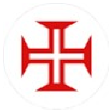
Figura 6 - A Cruz de Cristo, presente em todas as aeronaves da Força Aérea.