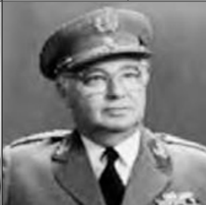
General Cerqueira Rocha