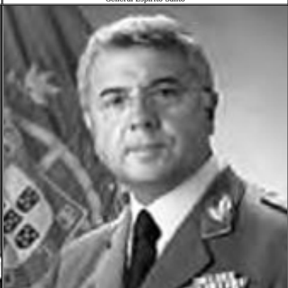
General Valença Pinto