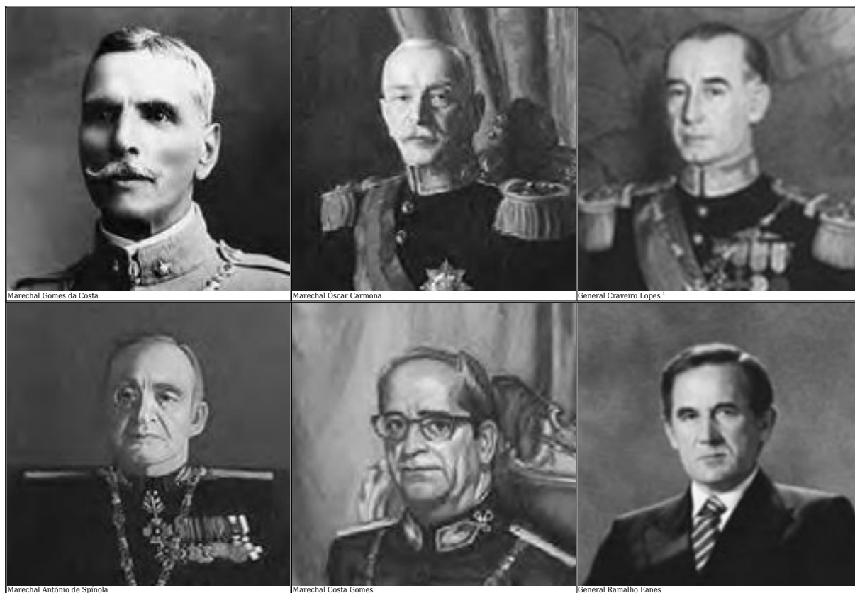
Figura 1 - Generais do Exército que desempenharam o cargo de Presidente da República.

desenvolvimento dos trabalhos constatou-se existir matéria excessiva para publicação da primeira parte num único livro.