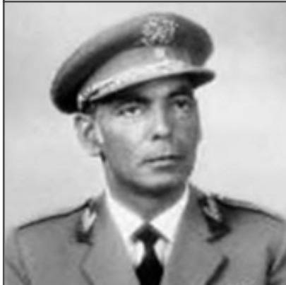
General Loureiro dos Santos