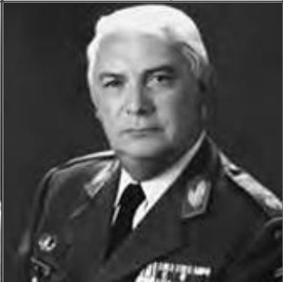
General Espirito Santo