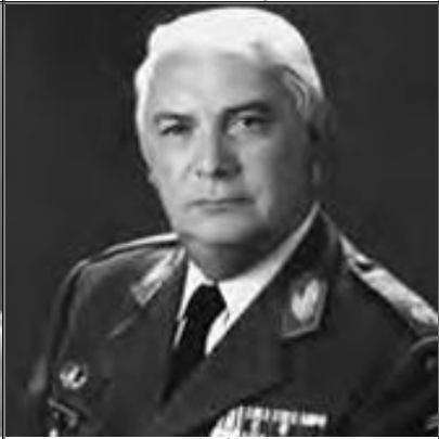
General Espirito Santo