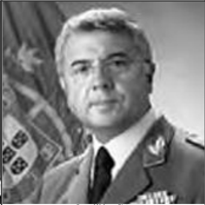
General Valença Pinto