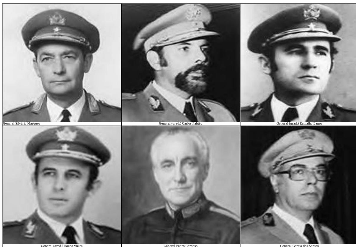
Figura 2 - Generais Chefes do Estado-Maior do Exército que exerceram funções depois do 25 de abril de 1974

Tem também um Aditamento ao 2.º Tomo do II Volume, com as biografias de nove oficiais que ascenderam ao generalato no Séc. XIX e cujos registos não tinham sido encontrados na pesquisa inicial; assim como outro Aditamento, na colaboração do Major Nick Hallidie, do Exército britânico, com as biografias dos oficiais ingleses que serviram como generais no Exército português no Séc. XIX, sendo duas novas e 24 corrigidas e aumentadas. Todos os oficiais generais promovidos até 1961 (inclusive) já tinham falecido quando foram publicadas as suas biografias. Destes tomos constam ainda biografias de oficiais do Exército Ultramarino (ou Colonial), extinto na década de 1930.