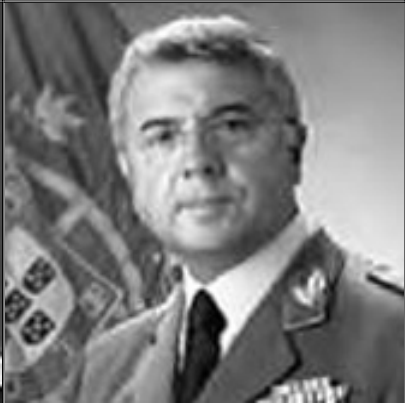
General Valença Pinto