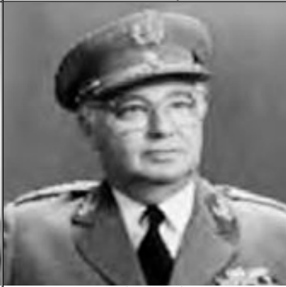
General Cerqueira Rocha