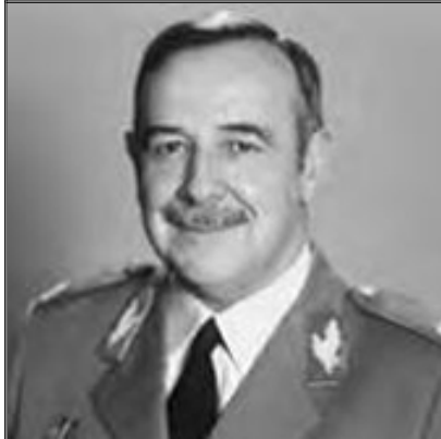
General António Barrento