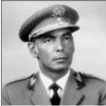
General Loureiro dos Santos