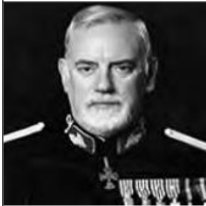
General Pinto Ramalho