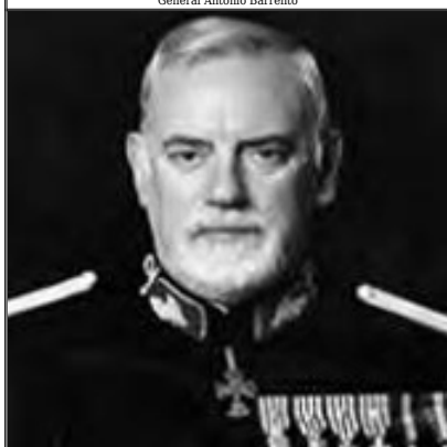
General Pinto Ramalho