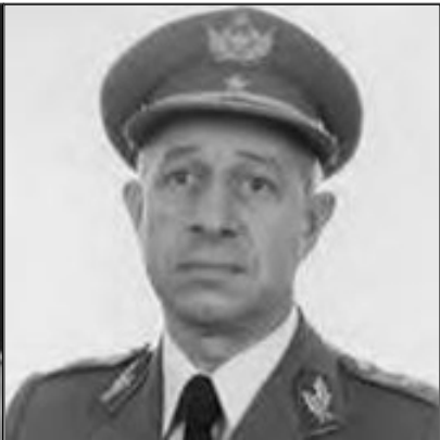
General Firmino Miguel