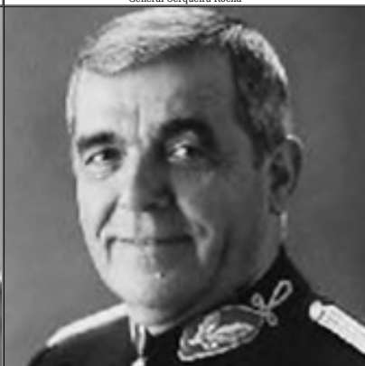
General Silva Viegas