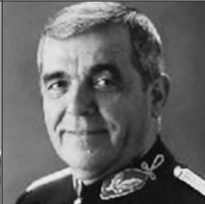
General Silva Viegas