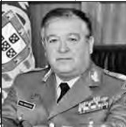
General Pina Monteiro