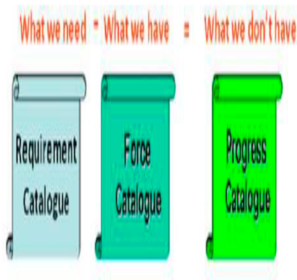
Figura 1 40 - Os Catálogos da UE em esquema.

A elaboração do PC foi um processo complexo e demorado, uma vez que os Estados-membros ofereceram forças e não capacidades militares, motivo pelo qual houve que analisar, força a força, a que capacidades elas correspondiam no Catálogo de Requisitos, para, após aturada análise, se determinarem as lacunas existentes.