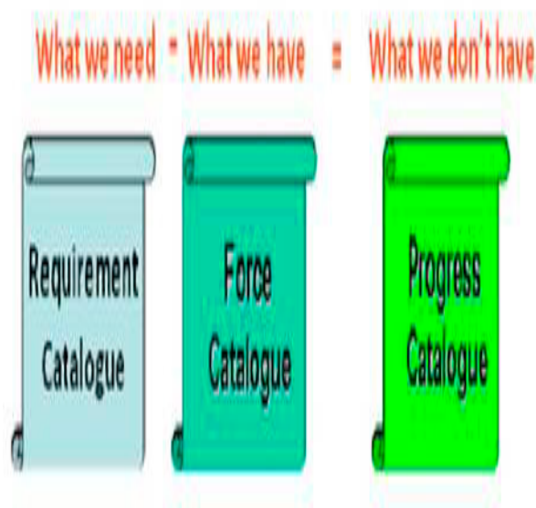
Figura 1 40 - Os Catálogos da UE em esquema.

A elaboração do PC foi um processo complexo e demorado, uma vez que os Estados-membros ofereceram forças e não capacidades militares, motivo pelo qual houve que analisar, força a força, a que capacidades elas correspondiam no Catálogo de Requisitos, para, após aturada análise, se determinarem as lacunas existentes.