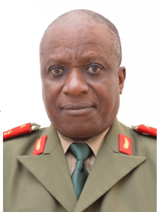
Tenente-general Miguel Júnior