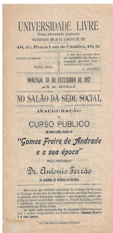
Figura 11 - Divulgação do Curso da Universidade Livre.

A Universidade Livre, instituição fundada em 1911, por iniciativa da Maçonaria, dirigida durante muitos anos pelo destacado maçom Alexandre Ferreira, organizou um curso em cinco lições intitulado «Gomes Freire de Andrade e a sua Época», ministrado por António Ferrão numa missão da Academia das Ciências na sua obra de extensão académica. O curso, acompanhado de «projeções luminosas», iniciou-se a 30 de Setembro de 1917. António Ferrão tinha sido iniciado em 1907 na Loja Solidariedade , mas não se encontrava activo desde 1914, só vindo a ser regularizado em 1924 na Loja Madrugada . Publicou, em 1918, o livro Gomes Freire na Rússia [14] e, dois anos depois, publicava o texto de um discurso que proferira em 18 de Novembro de 1917, intitulado Gomes Freire e as Virtudes da Raça Portuguesa [15] .