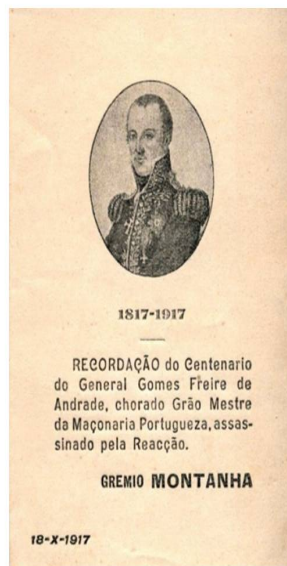
Figura 9 - Selo comemorativa.