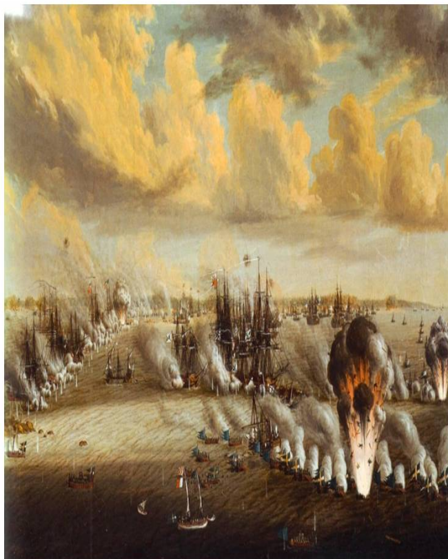
Figura 4 - Batalha de Svensksund (1790).

afundava. Gomes Freire permaneceu sempre na sua posição encorajando as guarnições das peças de artilharia, dando o exemplo junto dos subordinados, debaixo do fogo inimigo.