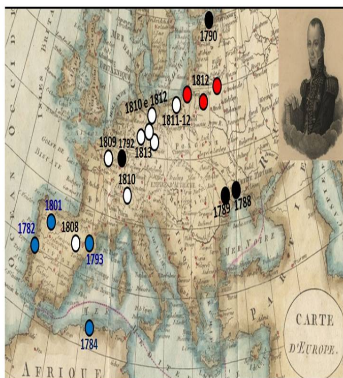
Figura 6 - Representação dos locais mais importantes da carreira militar de Gomes Freire de Andrade.

Depois de uma intensa e muito diversificada carreira militar, vivida entre os 25 e os 56 anos de idade, regressou a Lisboa, onde foi condenado à morte, em 1817, aos 60 anos de idade. Entre o seu batismo de fogo, em 1784, e o seu último combate, em São Julião da Barra, em 1817, navegou pelo Mediterrâneo, no Mar Negro e no Báltico e combateu de Portugal até à Rússia.