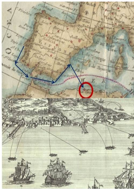
Figura 2 - Percurso da Expedição a Argel (1784) e gravura com lanchas bombardeiras.

A utilização destas lanchas, como pequenas baterias de artilharia avançadas, tinha o objetivo de promover a mobilidade e a flexibilidade de emprego à força naval atacante, deixando os navios mais pesados (as naus e as fragatas) mais afastados da artilharia inimiga em terra. As “lanchas bombardeiras” e as “baterias flutuantes” (usadas mais tarde noutra campanha que iremos referir) tinham missões muito arriscadas, pois eram normalmente deixadas pelos navios maiores em missões autónomas, muito expostas ao fogo do inimigo.