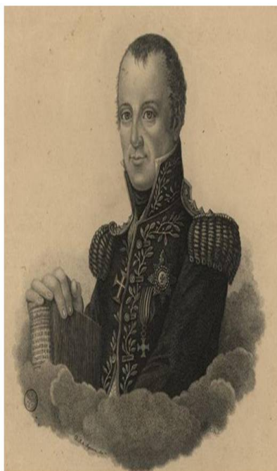
Figura 1 - General Gomes Freire de Andrade.

curiosamente na mesma época em que Clausewitz também escreveu sobre a importância do triângulo Exército - Governo - População.