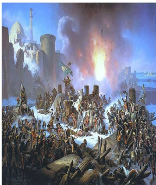
Figura 3 - Cerco à cidade de Oczacow, em 1788.

Em 1786, começou uma nova fase deste conflito e a Rússia desenvolveu uma campanha militar, dirigida pelo célebre General Potemkine, para conquistar a Crimeia. Gomes Freire participou nesta campanha, após se ter apresentado na capital russa (S. Petersburgo), em Julho de 1788, sendo enviado logo para a guerra integrando as forças do príncipe Potemkine. Através da obra de António Ferrão [5] podemos acompanhar o percurso de Gomes Freire na Rússia, acompanhado de outros dois oficiais portugueses: Manuel Inácio Martins Pamplona Corte Real e António de Souza Falcão. Gomes Freire apresentou-se a Potemkine quando este preparava a campanha terrestre e o cerco à praça de Oczacow. A esquadra russa já se tinha apoderado de Cronstadt mas as suas forças terrestres tinham ficado imobilizadas em Oczacow [6] perante a forte resistência turca naquela praça de guerra.