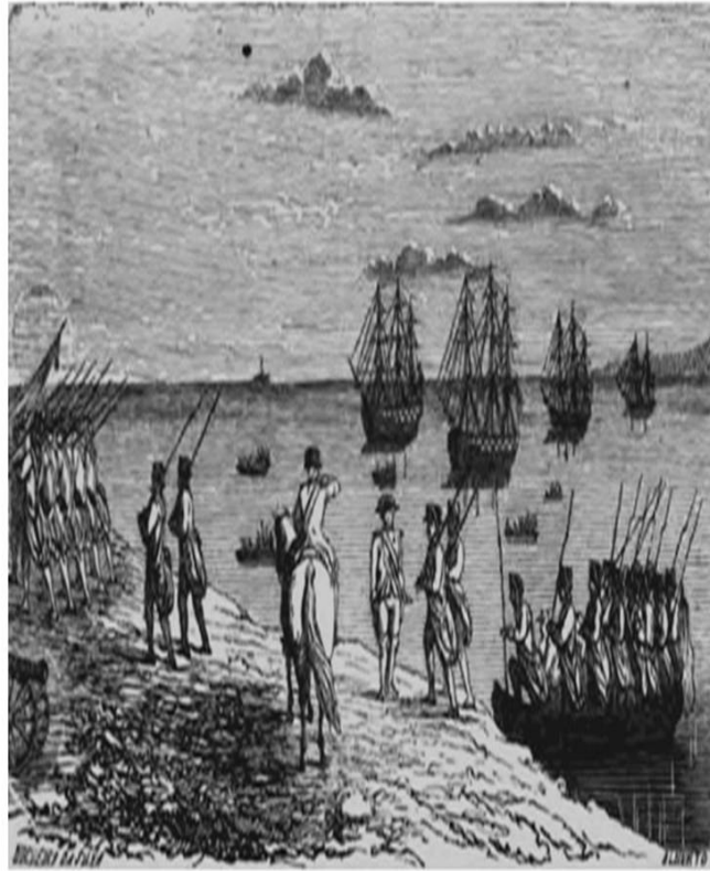
Figura 5 - Desembarque da Divisão Portuguesa na Catalunha (1793).

A 26 de Novembro de 1793, durante um ataque dos franceses, as linhas defensivas dos espanhóis cederam, colocando em risco toda a defesa aliada. Gomes Freire apercebeu-se do perigo e por sua iniciativa avançou rapidamente para a aldeia de Ceret, com cerca de 200 portugueses, uma força ligeira, mas que conseguiu aguentar as posições, salvando as unidades aliadas de serem liquidadas.