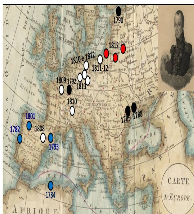
Figura 6 - Representação dos locais mais importantes da carreira militar de Gomes Freire de Andrade.

Depois de uma intensa e muito diversificada carreira militar, vivida entre os 25 e os 56 anos de idade, regressou a Lisboa, onde foi condenado à morte, em 1817, aos 60 anos de idade. Entre o seu batismo de fogo, em 1784, e o seu último combate, em São Julião da Barra, em 1817, navegou pelo Mediterrâneo, no Mar Negro e no Báltico e combateu de Portugal até à Rússia.