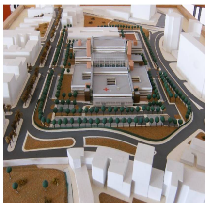
Figura 5 - Maquete de um dos projectos do novo HMP no Anexo de Campolide (Rua de Artilharia 1) - DIE.