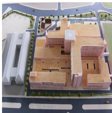
Figura 6 - Outro projecto do novo Hospital no Anexo de Campolide (Rua de Artilharia 1) - DIE.

O Exército, nos anos de 1980, volta a estudar a possibilidade de novo hospital, colocando-se duas hipóteses relativamente à localização: no anexo de Campolide (figuras 5 e 6), na Rua de Artilharia 1, ou junto ao Laboratório Militar (denominação completa: Laboratório Militar de Produtos Químicos e Farmacêuticos - LMPQF), na Avenida Alfredo Bensaúde 10 . Entretanto, na década de 1990, foram constituídos os chamados Serviços de Utilização Comum (SUC), procurando racionalizar meios dos três Ramos.