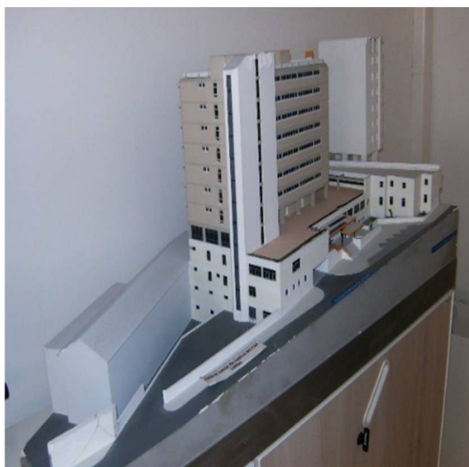
Figura 4 - Maquete do Pavilhão da Saúde Militar (DIE).

A criação da CPISFA, abreviatura de Comissão Permanente Interserviços de Saúde das Forças Armadas (Directiva n.º 4/76 do CEMGFA, de 30 de Outubro), com o objectivo de estudar e planear a integração dos Serviços de Saúde dos três Ramos num único SSM e promover colaboração/coordenação com o Serviço Nacional de Saúde (SNS), conseguiu apenas a génese da Escola do Serviço de Saúde Militar (ESSM).