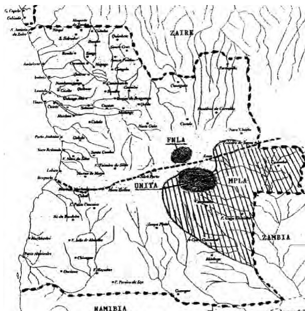
Figura 15 - Áreas de implantação dos movimentos.