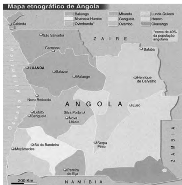
Figura 14 - Regiões político-militares do MPLA.