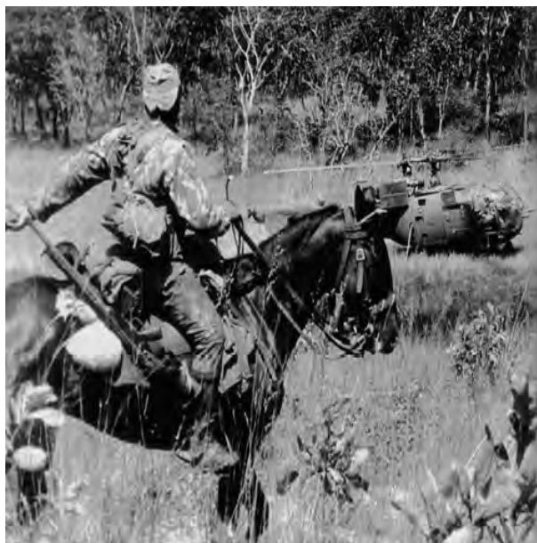
Figura 2 - Perante novos equipamentos, o cavalo não perdeu atualidade, embora estes meios aéreos em muito tenham contribuído para o seu apoio, principalmente em operações de reabastecimento de combatentes e solípedes.

Curiosamente, um país - a Suíça - que é peculiar em relação às suas forças armadas, nos exercícios de mobilização e treino apresenta unidades a cavalo e em bicicleta.