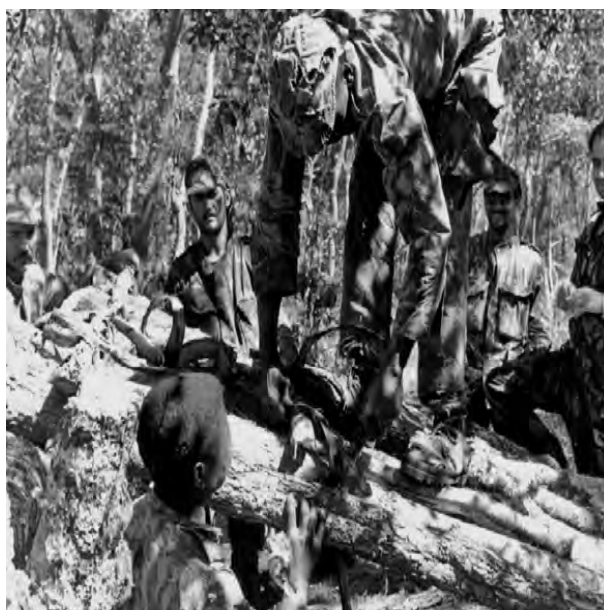
Figura 4 - Uma fase da construção de uma jangada.

Os rios são bem exemplo disso e, para ultrapassar estes obstáculos, algumas vezes foi necessária a construção de jangadas.