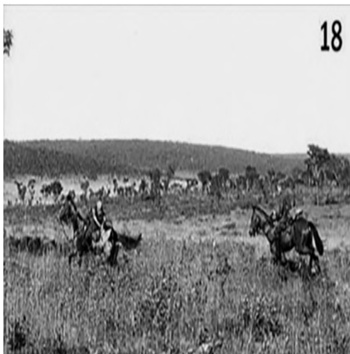
Figura 10 - Perseguição e captura de um guerrilheiro

Se tivermos em consideração a volumetria do conjunto cavaleiro e cavalo aparelhado com os apetrechos necessários para a operação (podia atingir os 150 kg), o que já por si representa algum efeito de massa, certamente que o pelotão (48 parelhas) e por maioria de razão o esquadrão (-) (dois pelotões) causarão, aos elementos apeados inimigos, sério desconforto. Mesmo em formação (coluna, cunha ou linha), o que obrigava sempre à dispersão, quer a nível de pelotão quer a nível de esquadrão e consoante o andamento imposto, provocava uma reação, no mínimo de respeito. Uma carga efetuada por um esquadrão supera em muito o poder ofensivo da tropa normal (apeada), transmitindo um efeito aterrorizante sobre quem é perseguido.