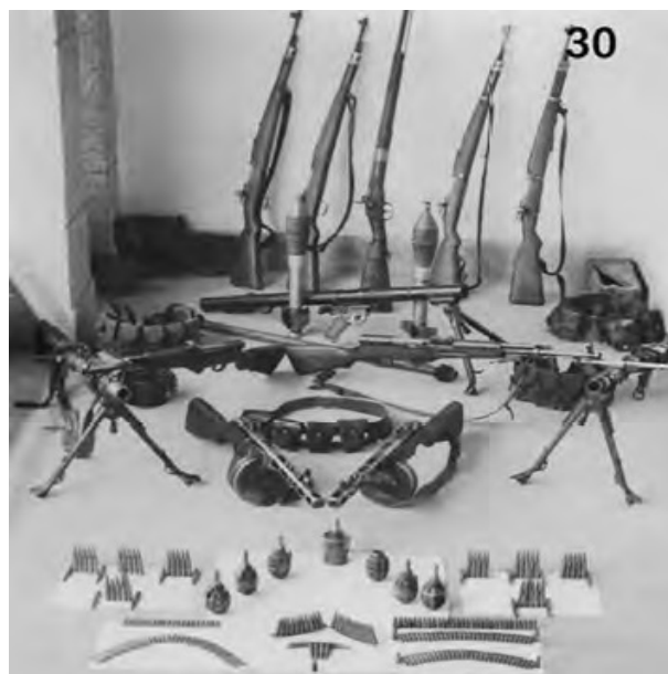
Figura 12 - Armamento apreendido numa das várias operações.

Neste caso concreto, a aplicação de esquadrões a cavalo no leste de Angola e no conjunto das operações, com vista a neutralizar a concretização da rota “Agostinho Neto” para atingir a I Região Militar (MPLA) onde permanecia uma bolsa cercada por elementos da FLNA, teve um efeito dissuasor de grande impacto e da maior importância, contribuindo significativamente para contrariar a vontade das forças adversas.