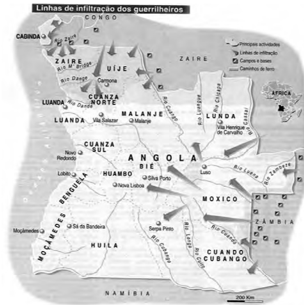
Figura 16 - Localização das bases dos movimentos.