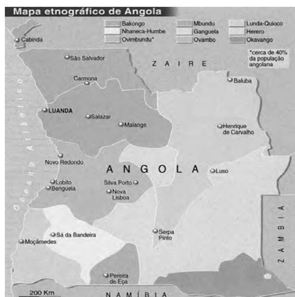
Figura 13 - A fronteira étnica ultrapassava a fronteira física.

Neste caso concreto, a aplicação de esquadrões a cavalo no leste de Angola e no conjunto das operações, com vista a neutralizar a concretização da rota “Agostinho Neto” para atingir a I Região Militar (MPLA) onde permanecia uma bolsa cercada por elementos da FLNA, teve um efeito dissuasor de grande impacto e da maior importância, contribuindo significativamente para contrariar a vontade das forças adversas.