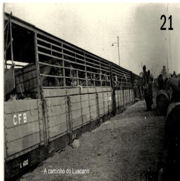
Figura 3 - Transporte mais usado pelo Esquadrão na sua deslocação para intervenções na Zona Militar Leste.