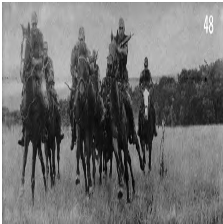
Figura 7 - Uma Secção em reação à ação do inimigo.

Acresce que a particularidade de o cavaleiro ter atribuída uma pistola e uma espingarda G3 fazia aumentar o poder de fogo, majorando aquela situação.