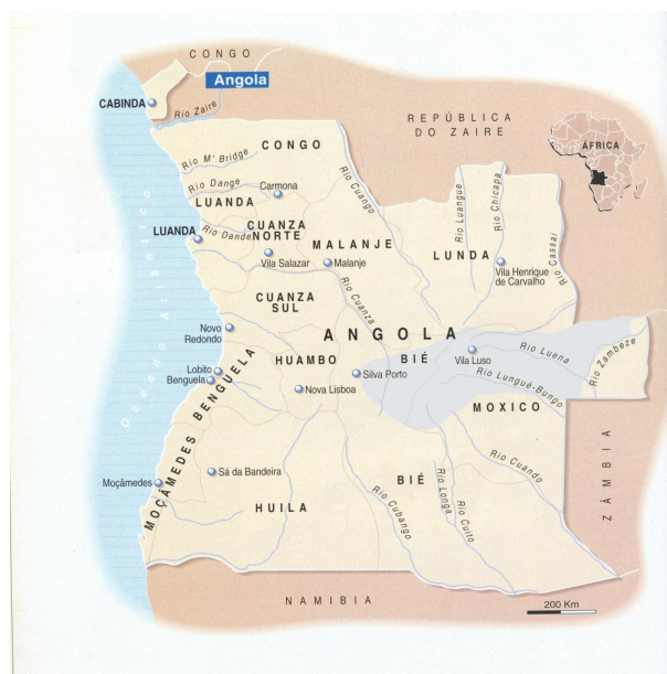
Figura 5 - Área de atuação dos esquadrões a cavalo.

As imagens abaixo poderão dar uma ideia da aplicabilidade e eficácia da tropa a cavalo, tendo em consideração a extensão da zona de ação.