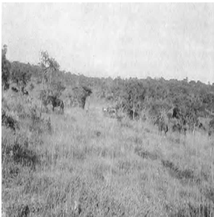
Figura 6 - Progressão em coluna na Chana.

Sendo outros os tempos, os meios e as táticas de combate, esta vulnerabilidade, comparada com a capacidade de atuação de surpresa, a imprevisibilidade da escolha do itinerário para alcançar o objetivo da operação, a dispersão (entre cada conjunto cavaleiro e cavalo a distância, que variava entre os 15 e os 50 metros, dependente do terreno) e a capacidade rápida de envolvimento à carga, era minimizada por estas possibilidades e o efeito psicológico criado sobre o inimigo.