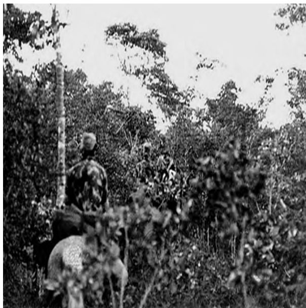
Figura 8 - Em progressão com uma boa camuflagem.