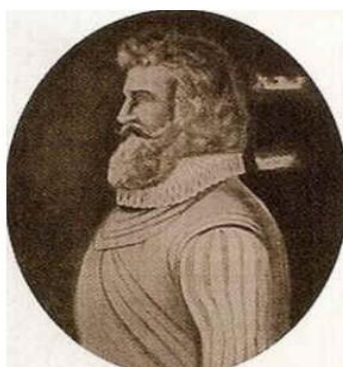
Figura 1 - Pedro Teixeira.

É sabido - mas não suficientemente combatido - como a ignorância sobre o Brasil e nomeadamente a sua História, grassa do lado português, não sendo melhor o que se passa do outro lado do Atlântico relativamente a Portugal. Com a particularidade negativa na parte brasileira, de haver correntes de opinião muito críticas ou desdenhosas da acção dos portugueses em “Terras de Vera Cruz”. Já para não falar das tentativas mais modernas no tempo, de tentar reescrever, desvirtuar e até subverter, toda a História passada. De que a remoção de estátuas é apenas um dos lamentáveis episódios.