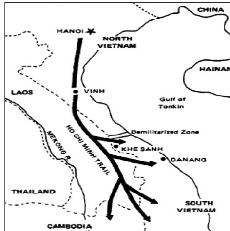
Figura 1 - A pista de Ho Chi Minh [8] .

No dia 23 de Julho de 1962, foi assinado o acordo de neutralidade do Laos [9] . Neste mês, as Special Forces do Exército dos EUA estabeleceram um campo em Khe Sanh (figura 2) [10] . A 6 de Outubro, todos os conselheiros militares estado-unidenses tinham retirado do Laos e as acções do ERVN cessado, mas o ENV continuou a ocupar o território por onde passava a pista de Ho Chi Minh [11] .