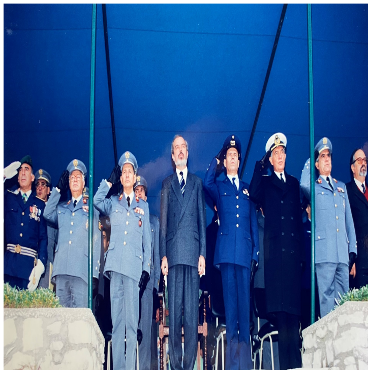
Tancos, 30 de Dezembro de 1993, os principais protagonistas da fase final do processo de transferência, na cerimónia de extinção do CTP e activação do CTAT/BAI, presidida pelo Ministro da Defesa Nacional, Fernando Nogueira.