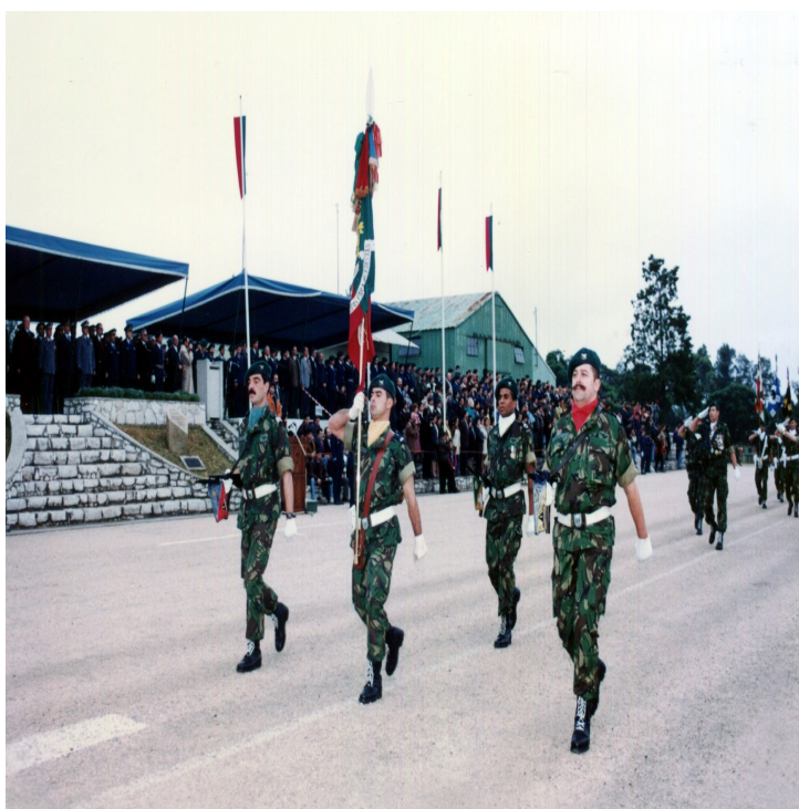
Tancos, 30 de Dezembro de 1993, o Estandarte Nacional do Corpo de Tropas Paraquedistas da Força Aérea desfila pela última vez na sua história. Actualmente, está no Museu das Tropas Paraquedistas.

No dia 1 de Janeiro de 1994, “apresentaram-se” no Exército 2.174 militares paraquedistas no Activo, 74 na situação de Reserva fora da efectividade de serviço e 108 militares em preparação, totalizando 2.356 militares, além de 191 funcionários civis. A estes, juntaram-se 144 militares das várias armas e serviços do Exército, incluindo Comandos, que frequentam o curso de paraquedismo militar em Tancos, ainda no final do ano de 1993.