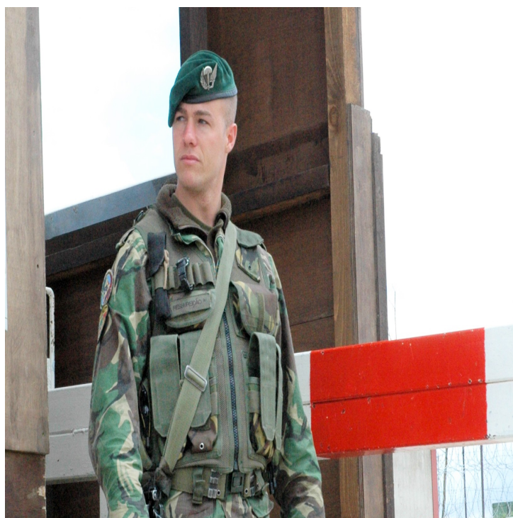
Militar paraquedista em serviço no Kosovo (2007), ostenta na boina verde, a insígnia criada em 2003 para as tropas paraquedistas.

Infelizmente, na altura, não foi acautelada uma questão importante que estava na legislação desde a fundação dos paraquedistas, o uso da boina verde. Com a revogação de toda a legislação anterior, nomeadamente a da fundação e ainda, naturalmente, a Portaria do Regulamento de Uniformes da Força Aérea, onde esse artigo de uniforme estava previsto, alteraram-se no Exército as condições de atribuição e de uso boina verde. Ainda hoje, não estão totalmente resolvidas e tem dado, como é público, muitos problemas. O Exército teima em regulá-la por um mero despacho do CEME e não por Portaria, como, aliás, está, por exemplo, a azul da Força Aérea (Policia Aérea) ou a Azul-ferrete da Marinha (Fuzileiros). É uma das “pontas soltas” da transferência... há 30 anos! Há outras.