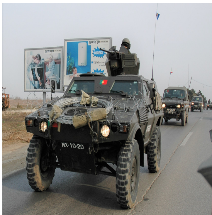
O Esquadrão de Reconhecimento da Brigada Aerotransportada Independente recebeu as Panhard Ultrav M11, Viatura Tática Ligeira Blindada de Reconhecimento.

Entre 1994 e 2006, as Tropas Aerotransportadas mantiveram um comando de natureza territorial, o CTAT, e um de natureza operacional, a BAI. Este dispositivo era guarnecido - dez anos depois da transferência - por um número de pessoal especializado em paraquedismo praticamente igual ao que existia no Corpo de Tropas Paraquedistas na Força Aérea. 2.174 Páras transferidos, em 1994, passados dez anos havia 2.288, apenas mais 114.