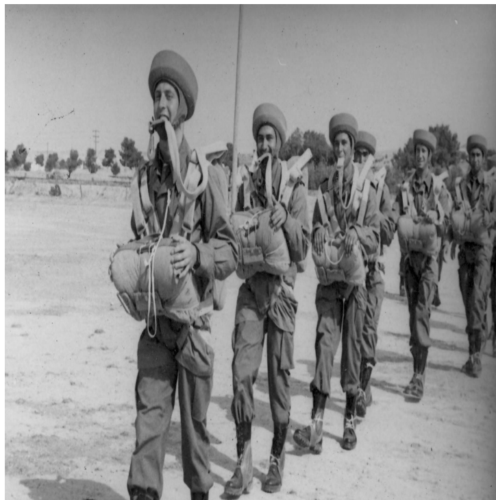
Alcantarilla, Espanha, 1955, militares portugueses do chamado “Curso de Espanha” que viria a permitir constituir o Batalhão de Caçadores Paraquedistas, oficialmente a 1 de Janeiro de 1956.

Em Portugal, as primeiras decisões e estudos que levariam ao processo de criação das Tropas Paraquedistas foram iniciados no Exército, em 1951, passando depois para a dependência directa do Ministro da Defesa Nacional. A Força Aérea, contudo, manifestou-se então frontalmente contra a sua inserção no recém-criado ramo das Forças Armadas (1952). O Chefe de Estado-Maior das Forças Aéreas, como então se designava, General Carlos da Costa Macedo, em Abril de 1955, fê-lo em termos duros, por escrito, num documento com cinco páginas enviado ao Chefe do Estado-Maior-General das Forças Armadas (CEMGFA). Foi, no entanto, firme o Ministro da Defesa Nacional, Fernando dos Santos Costa, o qual assumia pessoalmente este processo, e impôs à Força Aérea a nova unidade.