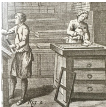
Recueil de Planches