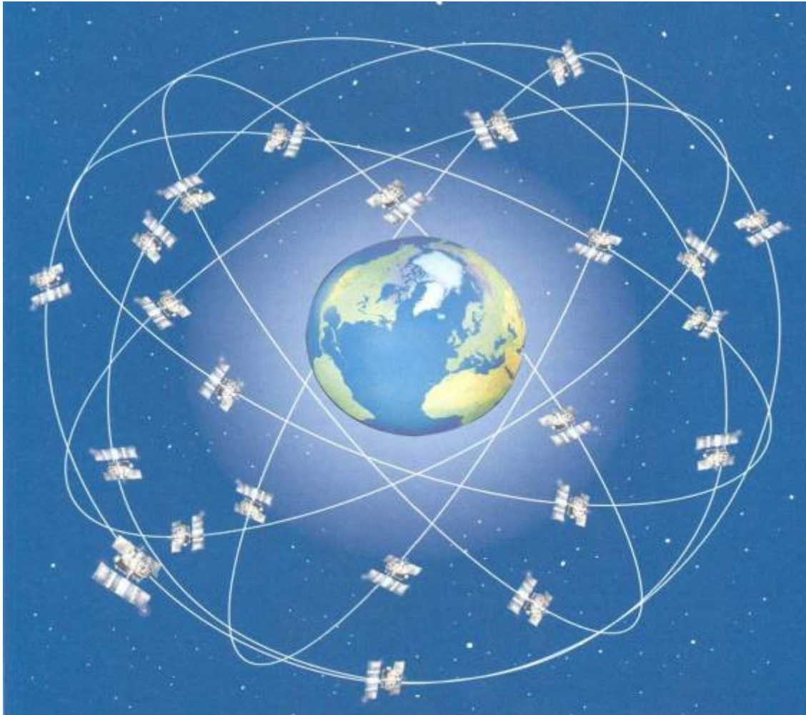
Figura 1 - Constelação de satélites GPS

Neste artigo, abordarei sobretudo a componente militar do GPS, pois é sobretudo essa que é empregue em teatros de operações militares e no guiamento preciso de mísseis e projecteis. Gostaria, também, de referir que, embora as matérias abordadas neste artigo sejam, de algum modo, sensíveis, toda a informação que avançarei é pública, tendo já sido abordada em revistas científicas e militares.