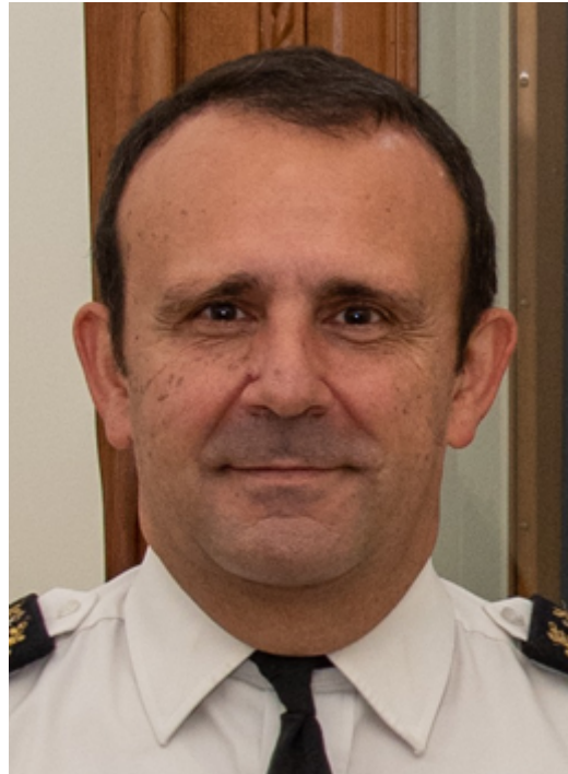
Contra-almirante Luís Nuno da Cunha Sardinha Monteiro

7 de Junho de 2006. Dois caças F-16 norte-americanos voam em missão de apoio a forças terrestres no Iraque, quando lhes é ordenado que ataquem um abrigo nos arredores de Baqouba, cerca de 50 km a nordeste de Bagdade, onde se suspeitava estar Abu Musab al-Zarqawi, o líder da al-Qaeda no Iraque. Os caças disparam duas munições: uma primeira com guiamento por GPS e uma outra com guiamento por laser. O abrigo é reduzido a escombros, provocando a morte do número um da al-Qaeda no Iraque e dando tradução no terreno a expressões como guerra cirúrgica , guerra de precisão e bombas inteligentes . Responsável máximo pelo surgimento destas expressões: o sistema de navegação por satélites GPS ( Global Positioning System ).