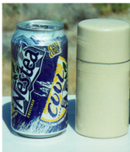
Figura 5 - Imagem de um empastelador de GPS de 1 W (Como comparação, apresenta-se ao lado do empastelador uma lata de Nestea ).