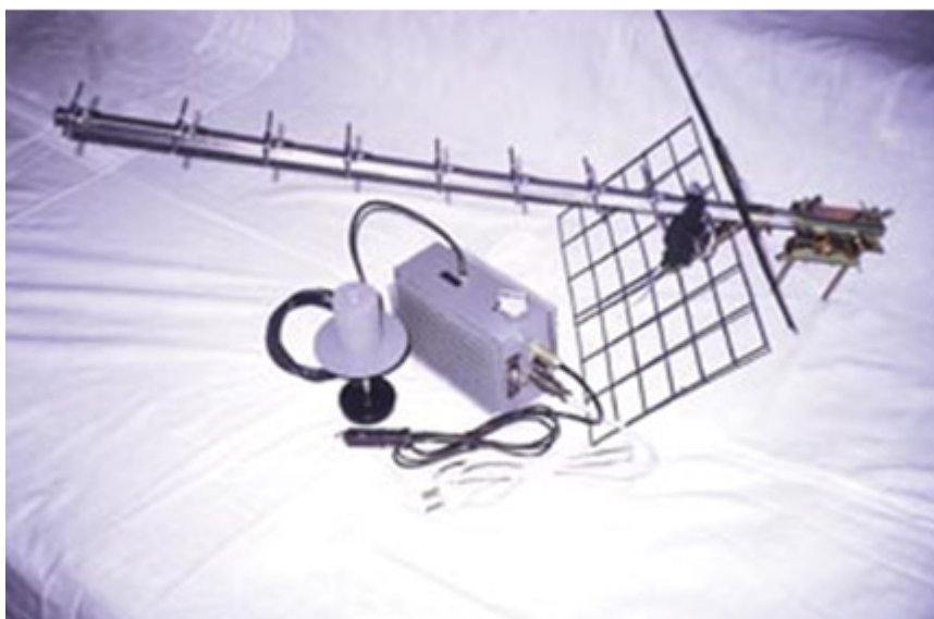
Figura 6 - Empastelador portátil de GPS de fabrico russo.

No entanto, apesar da dificuldade em empastelar o código militar do GPS, uma companhia Russa apresentou, no “ Paris Air Show ” de 1999, um empastelador portátil de 8 W (ver figura 6), anunciado como sendo capaz de empastelar tanto o código civil como o militar . Os vendedores da firma Aviaconversiya Ltd , afirmavam que este equipamento, bastante leve e pequeno (3 kg e 12X19X7 cm), conseguiria alcances de empastelamento de várias centenas de km, desde que estivesse à vista do receptor GPS vítima, sendo capaz de impedir um míssil Tomahawk de acertar no alvo. Este equipamento estava à venda, para quem o quisesse comprar, por pouco mais de 50 000 Euros 23 . Tanto quanto foi possível perceber pelas notícias que foram veiculadas pela comunicação social, as forças armadas do Iraque dispunham destes equipamentos e foi a eles que o governo americano se estava a referir quando apresentou um protesto diplomático à Rússia, acusando firmas desse país de terem vendido aos iraquianos equipamentos capazes de desviar os mísseis aliados.