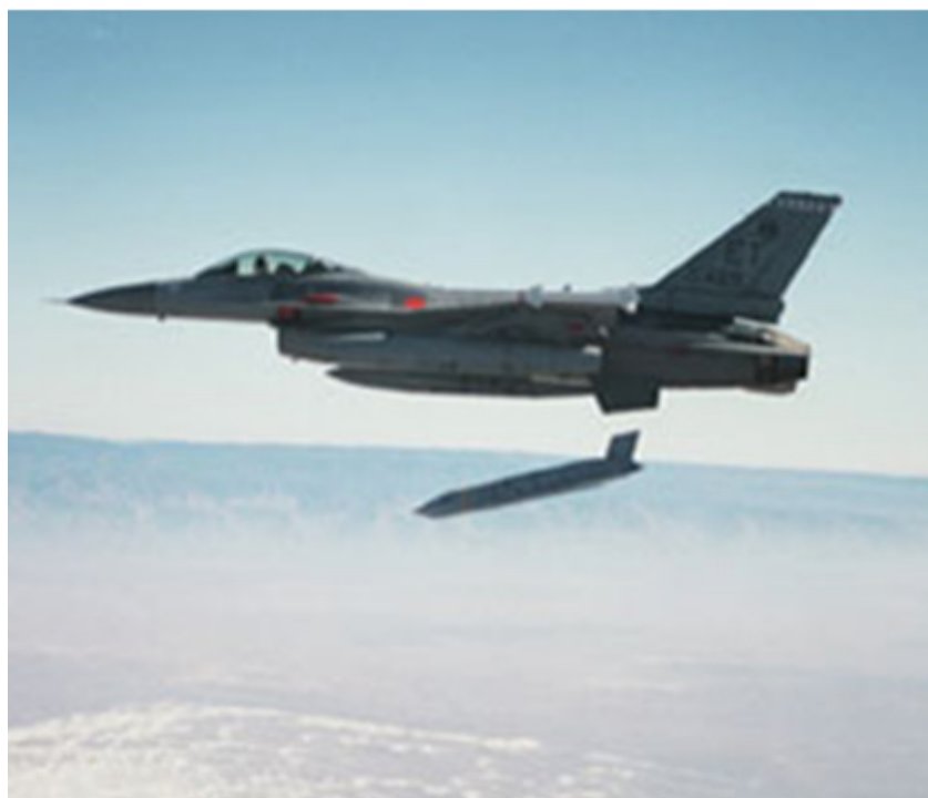
Figura 2 - Cça F-16 largando uma munição guiada por GPS.