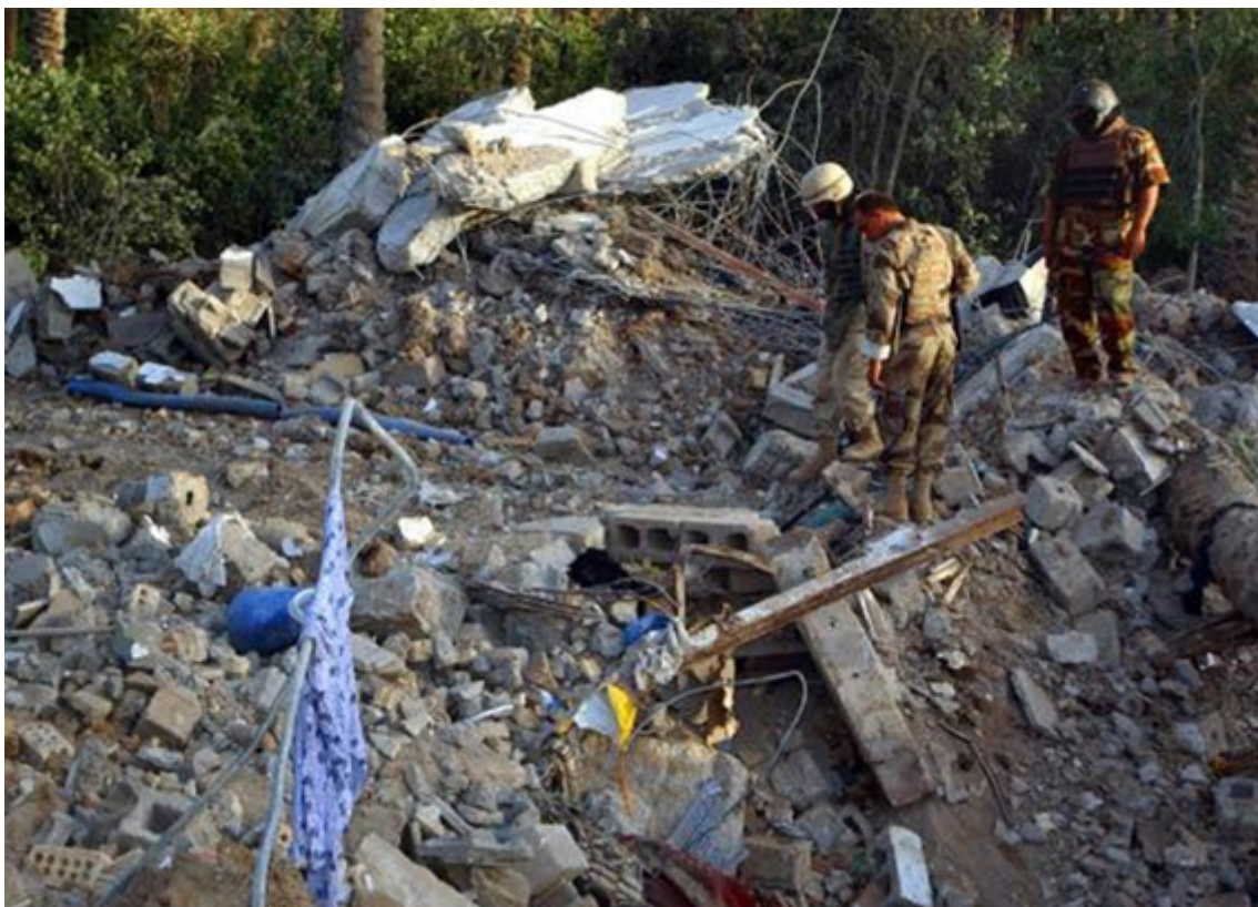
Figura 4 - Esconderijo de Al-Zarqawi após o ataque de 7 de Junho de 2006