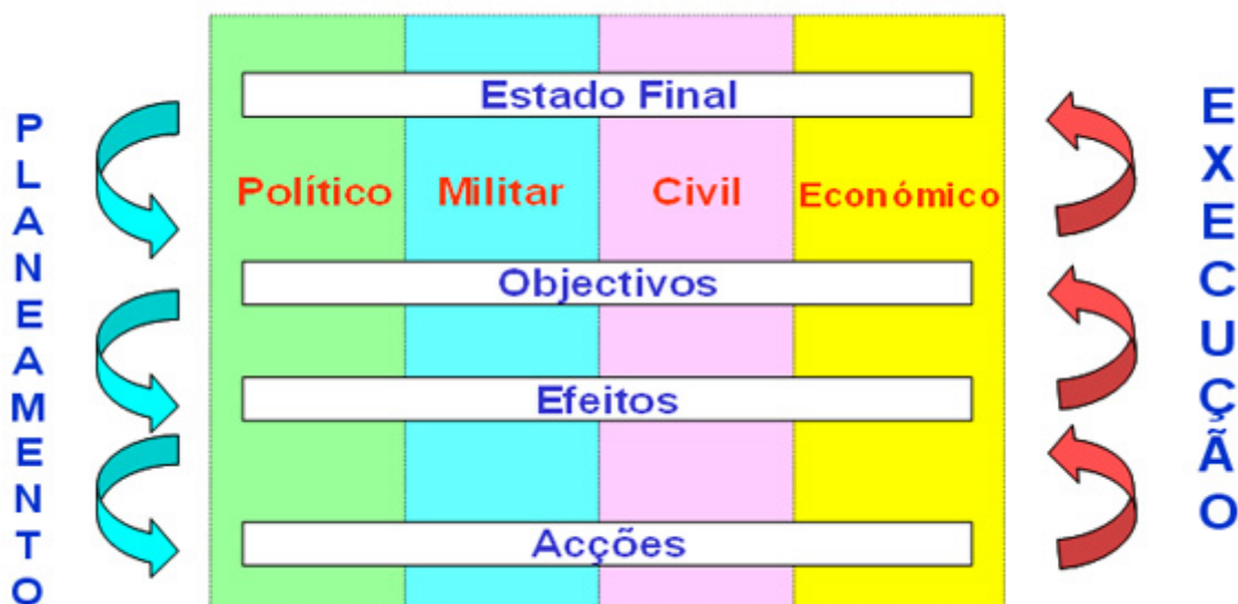
Figura 2 - Modelo teórico de EBAO 31

Por exemplo, em alternativa à destruição de carros de combate no campo de batalha, a interrupção do sistema ferroviário que transporta o combustível que os abastece será uma forma mais eficiente de alcançar o mesmo efeito estratégico. Da mesma forma, porquê arriscar dez aviões para destruir dez pontes, quando apenas um avião poderá destruir uma ponte que irá paralisar o abastecimento de combustível aos carros de combate. Para além disso libertaram-se nove aeronaves para concentrar noutros alvos críticos.