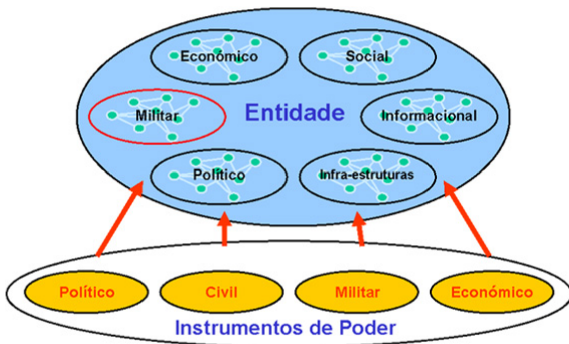
Figura 1 - Sistema PMESII 29

A grande diferença em relação ao passado, e a esperança futura, é a possibilidade de utilizar ferramentas informáticas de simulação que permitem uma maior compreensão dos efeitos intencionais, e dos indesejados, permitindo um planeamento de forma mais sistemática.