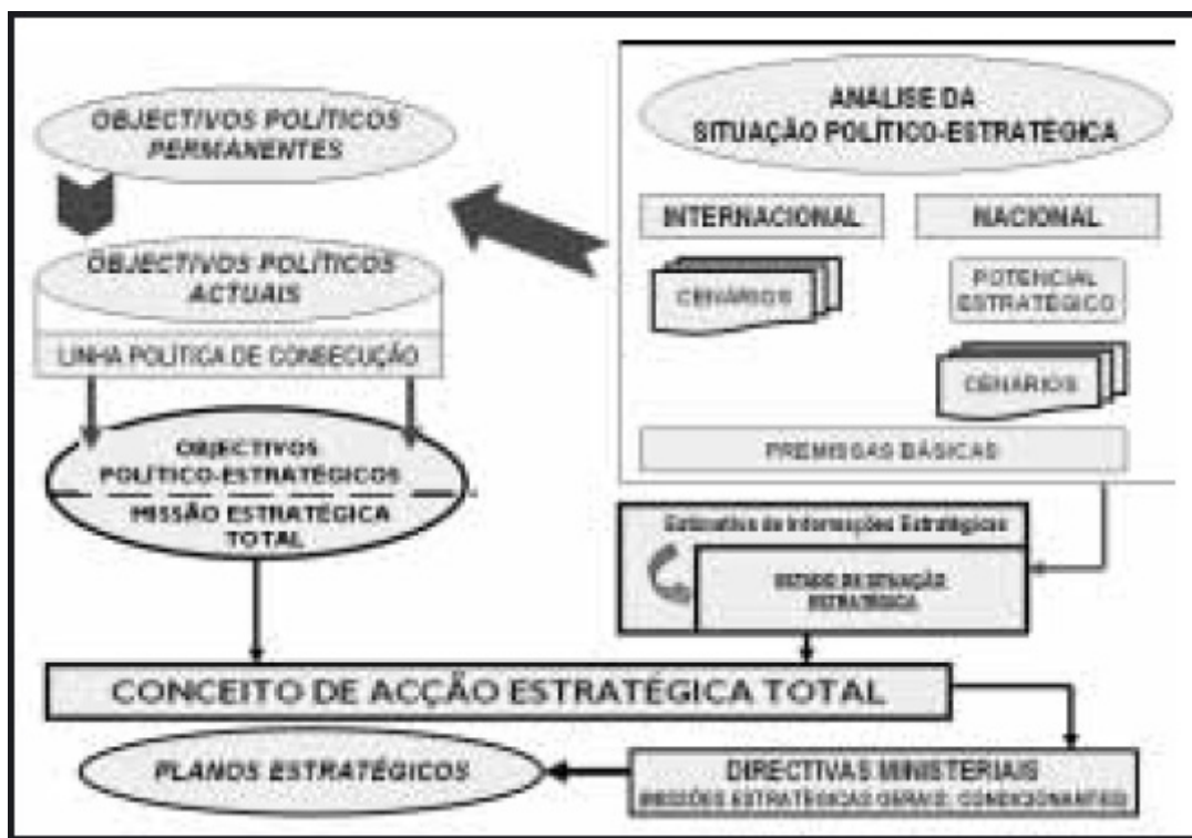
Figura 4 - Planeamento de acção estratégica total

A racionalidade da estratégia tem como consequência primária a resposta “às seguintes perguntas fundamentais: Que futuro se deve promover? Para o efeito, que ameaças ou obstáculos é necessário conjurar?” 18