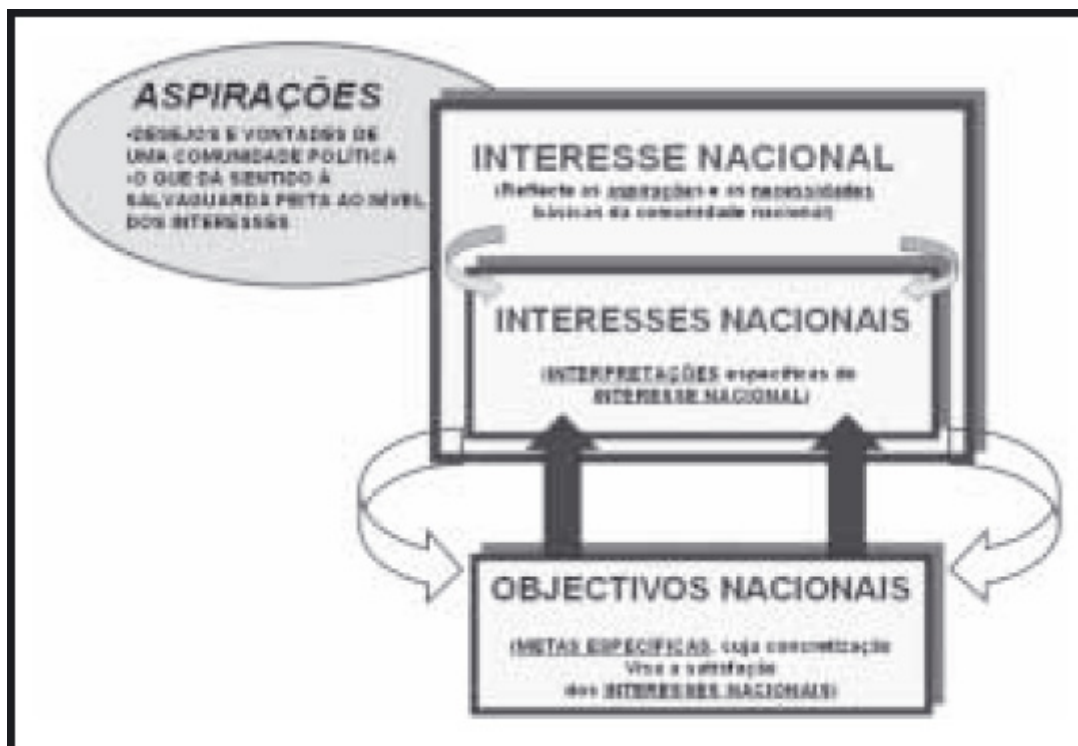
Figura 2 - Relação entre objectivos e interesses nacionais

Os objectivos devem reflectir um entendimento completo do estado final desejado, a natureza do ambiente, as directivas políticas e os efeitos de enésima ordem, a fim de criarem as condições para o estado final desejado.