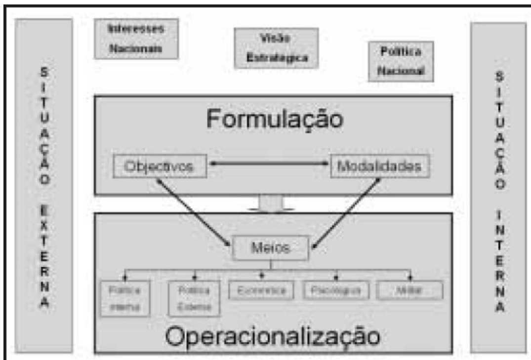
Figura 3 - Modelo de formulação estratégica ao nível da estratégia total (Fonte: adaptação de Bartholomees, p. 279)

O sucesso estratégico depende da multiplicidade de abordagens num ambiente estratégico complexo para alcançar os objectivos propostos. Por conseguinte, é normal que não se utilize apenas um instrumento de poder, mas que seja a combinação sinérgica dos efeitos de todos os poderes que permitem alcançar os objectivos. Este facto permite a flexibilidade necessária quando uma acção não tem o efeito desejado. Por conseguinte é muito mais fácil mudar o foco através de um conceito com múltiplas linhas de acção estratégica do que com um conceito que oriente apenas um instrumento de poder.