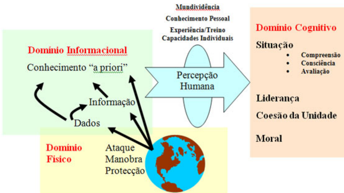
Figura 2 – Os Domínios da GCR

Existe uma relação entre cada um dos termos da linguagem utilizada e o domínio onde esse termo deve ser entendido. No domínio físico existe a situação que a força militar quer influenciar. É o domínio da realidade. Aí ocorre o ataque, a protecção e a manobra, no ambiente aeroespacial, naval e terrestre. É o domínio onde residem as plataformas físicas e as redes de comunicações que as interligam. Em termos comparativos, os elementos deste domínio são os mais fáceis de medir. Como consequência, o potencial de combate tem sido medido, ao longo do tempo, em termos de letalidade e sobrevivência, principalmente neste domínio.