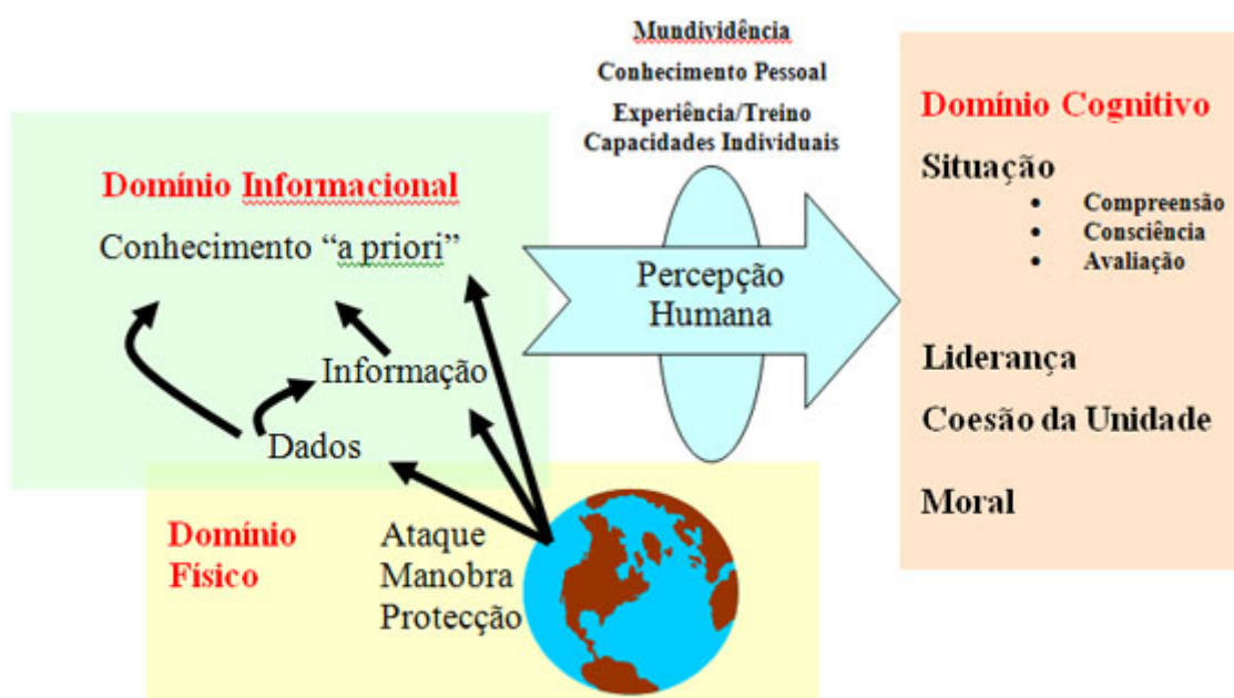
Figura 2 – Os Domínios da GCR

A segunda obra, Understanding Information Age Warfare , baseada na anterior, desenvolve uma autêntica teoria de operações em ambientes interligados em rede. É criada uma nova linguagem que inclui os termos “sentir” (directa e indirectamente), “observações” (dados), “informação”, “conhecimento”, “consciência”, “compreensão”, “partilha da informação”, “partilha do conhecimento”, “partilha da consciência”, “colaboração”, “decisões”, “acções” e “sincronização” e são definidos três domínios, a saber: o domínio físico, o domínio informacional e o domínio cognitivo, que se encontram ilustrados na Figura 2.