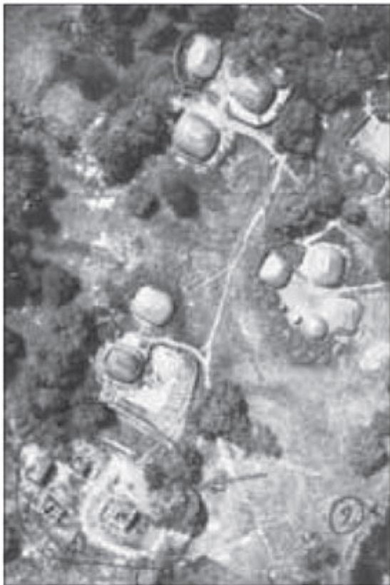
Organização defensiva com espaldões e envolventes de ninhos de metralhadoras.