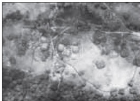
Paióis destruídos após impactos de bombas napalm , no alvo.