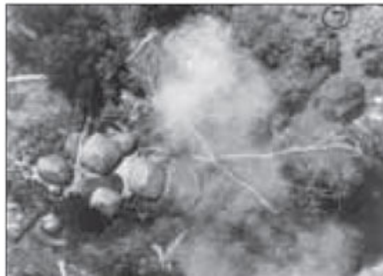
Impactos de bombas napalm .