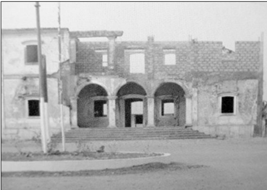
As instalações da antiga Câmara Municipal, foto cedida por Tito Osvaldo Dias Baião

Antes de nos debruçarmos propriamente sobre a independência de Angola e a guerra pelo poder político, no seio dos zombo, parece conveniente dedicarmos um último apontamento aos europeus ali residentes, sendo alguns filhos dessas mesmas terras. Sabemos que as palavras que proferimos ou escrevemos levam, ainda hoje e, por vezes, a