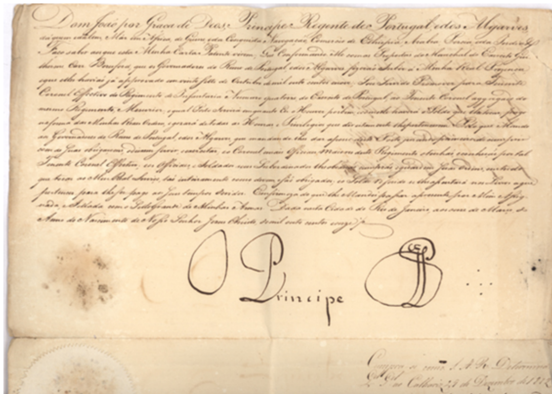
Fig 2 – Carta Patente de promoção do Tenente-Coronel agregado Havilland Le Mesurier a Tenente-Coronel do Regimento de Infantaria n° 14, assinada no Rio de Janeiro, por S.A.R. o Príncipe Regente, futuro D. João VI, (AHM)

A sua leitura nem sempre é fácil devido à caligrafia da época e aqueles que são impressos apresentam inúmeras gralhas.