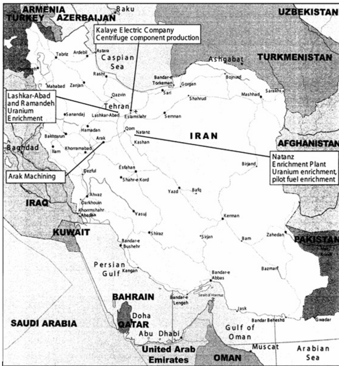
ANEXO V - Localização das Principais Bases de Mísseis Iranianos